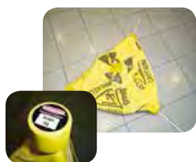
Kegel klapt in wanneer er gewicht op valt.