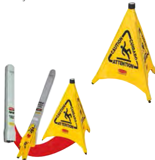
FG9S0000YEL / FG9S0100YEL