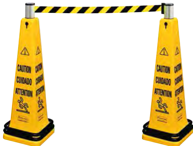
FG628700YEL x 2