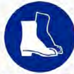
Veiligheidsschoenen verplicht Protection des pieds obligatoire