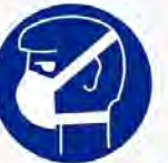
Stofmasker verplicht Casque anti-poussière obligatoire