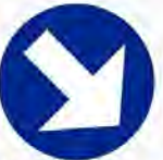
Verplichte richting Direction à suivre obligatoire