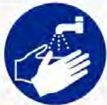
Handen wassen verplicht Lavez les mains obligatoire