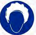
Dames haarnet verplicht Coiffe dames obligatoire