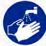
Handen wassen verplicht Lavez les mains obligatoire