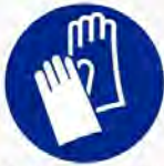
Veiligheidshandschoenen verplicht Protection des mains obligatoire