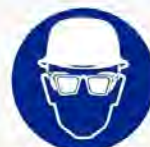
Helm & bril verplicht Casque & prot. des yeux obligatoire