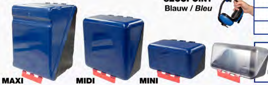
SECUPOINT Blauw / Bleu