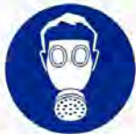
Adembescherming verplicht Protection des voies respiratoires obligatoire