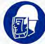
Gelaatsbescherming verplicht Protège-face obligatoire