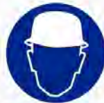
Veiligheidshelm verplicht Casque obligatoire