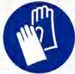
Veiligheidshandschoenen verplicht Protection des mains obligatoire