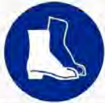
Veiligheidsschoenen verplicht Protection des pieds obligatoire