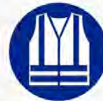
Signalatievest verplicht Gilet signalisation obligatoire