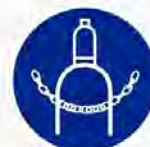
Gasfles verankeren verplicht Ancrer la bouteille de gaz obl.