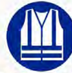
Signalatievest verplicht Gilet signalisation obligatoire