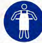
Veiligheidsschort verplicht Tablier de sécurité obligatoire