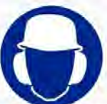
Helm en oorkap verplicht Casque et équip. anti-bruit obligatoire