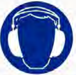
Gehoorscherming verplicht Casque anti-bruit obligatoire