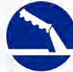
Handrem verplicht Frein à main obligatoire