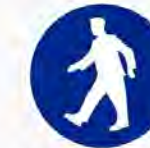
Doorgang toegestaan Passage autorisé