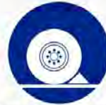
Remblokken verplicht Sabots obligatoires