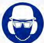
Helm, bril & oorkap verplicht Casque, lunettes et équip. anti-bruit obl.