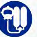
Ademhalingsapparaat verplicht Appareil respiratoire obligatoire