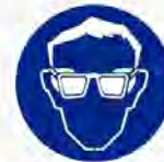
Oogbescherming verplicht Protection des yeux obligatoire