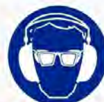
Bril & oorkap verplicht Lunettes & casque obligatoire