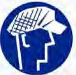
Heren haarnet verplicht Coiffe messieurs obligatoire