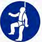
Individueel veiligheidsharnas verplicht Protège-chute obligatoire