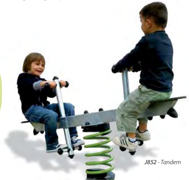
J852 - Tandem

De materiaal diversiteit en de kleuren versterken het idee van een gemengde speelruimte waar iedereen terecht kan.