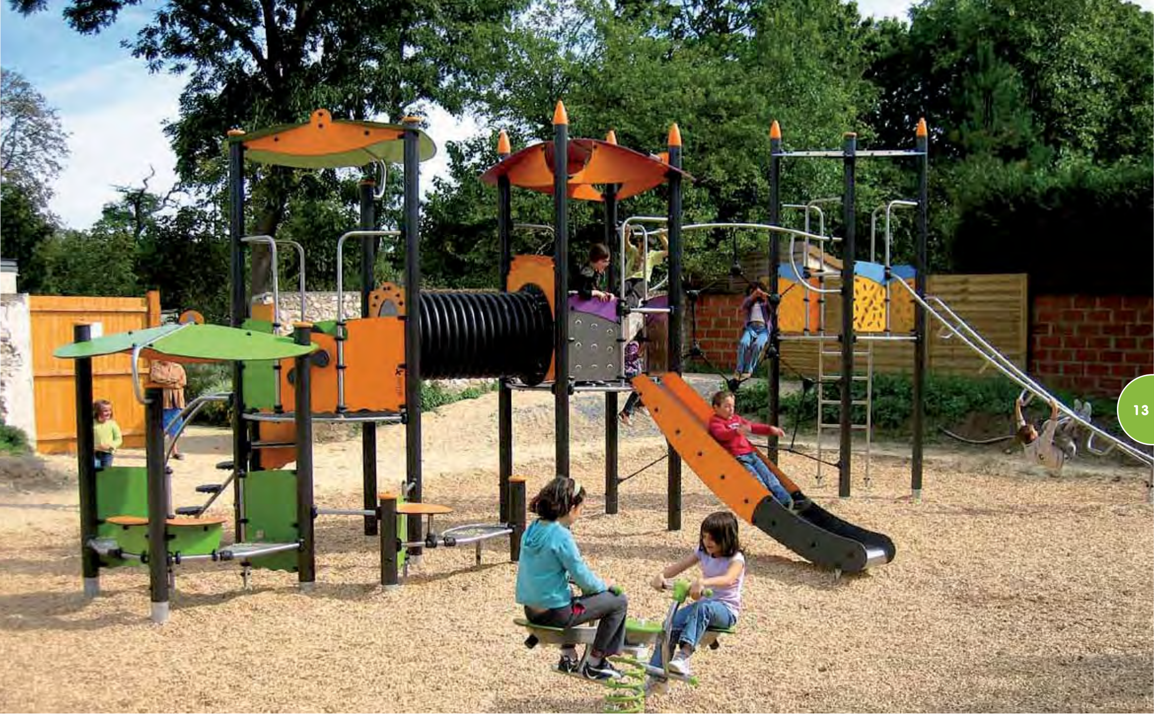
Speelterrein met een Biibox-structuur.