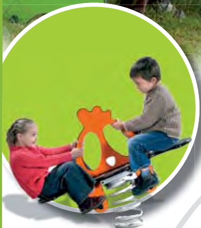
J838 - Kip