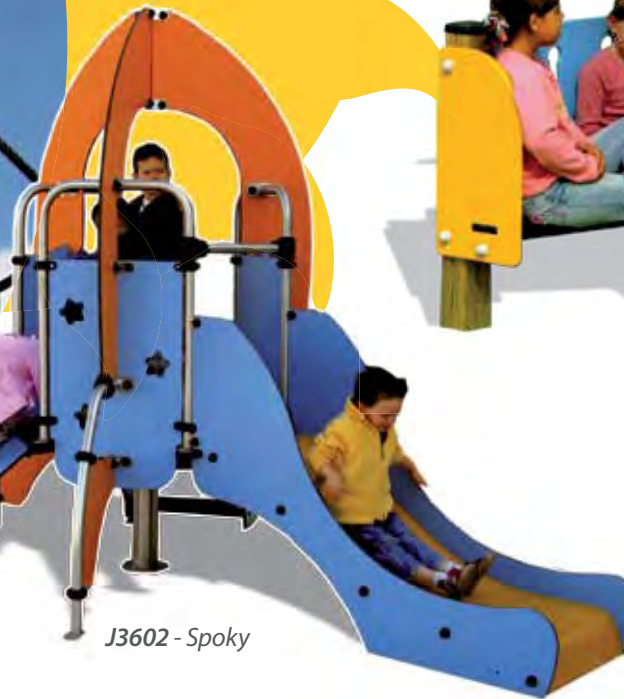
J3602 - Spoky

De vloer speelt een rol bij het aantrekkelijk maken van de ruimte. Het laat ieder toestel beter tot zijn recht komen.