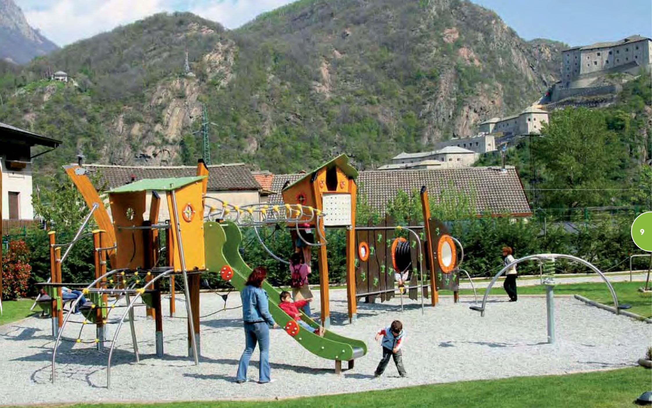
Speelterrein met een Kanopé-structuur en een Hip Hop-draaitoestel.