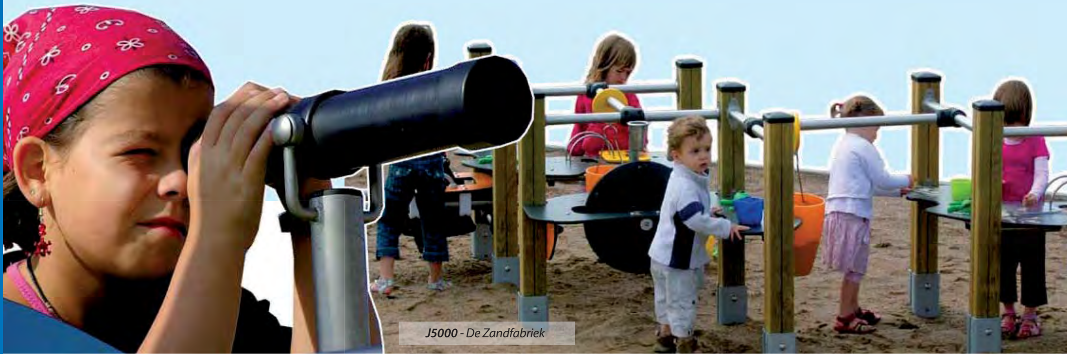
J5000 - De Zandfabriek