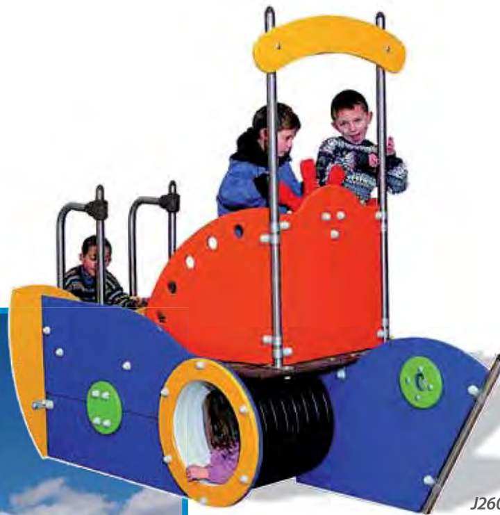
J2604 - Calypso