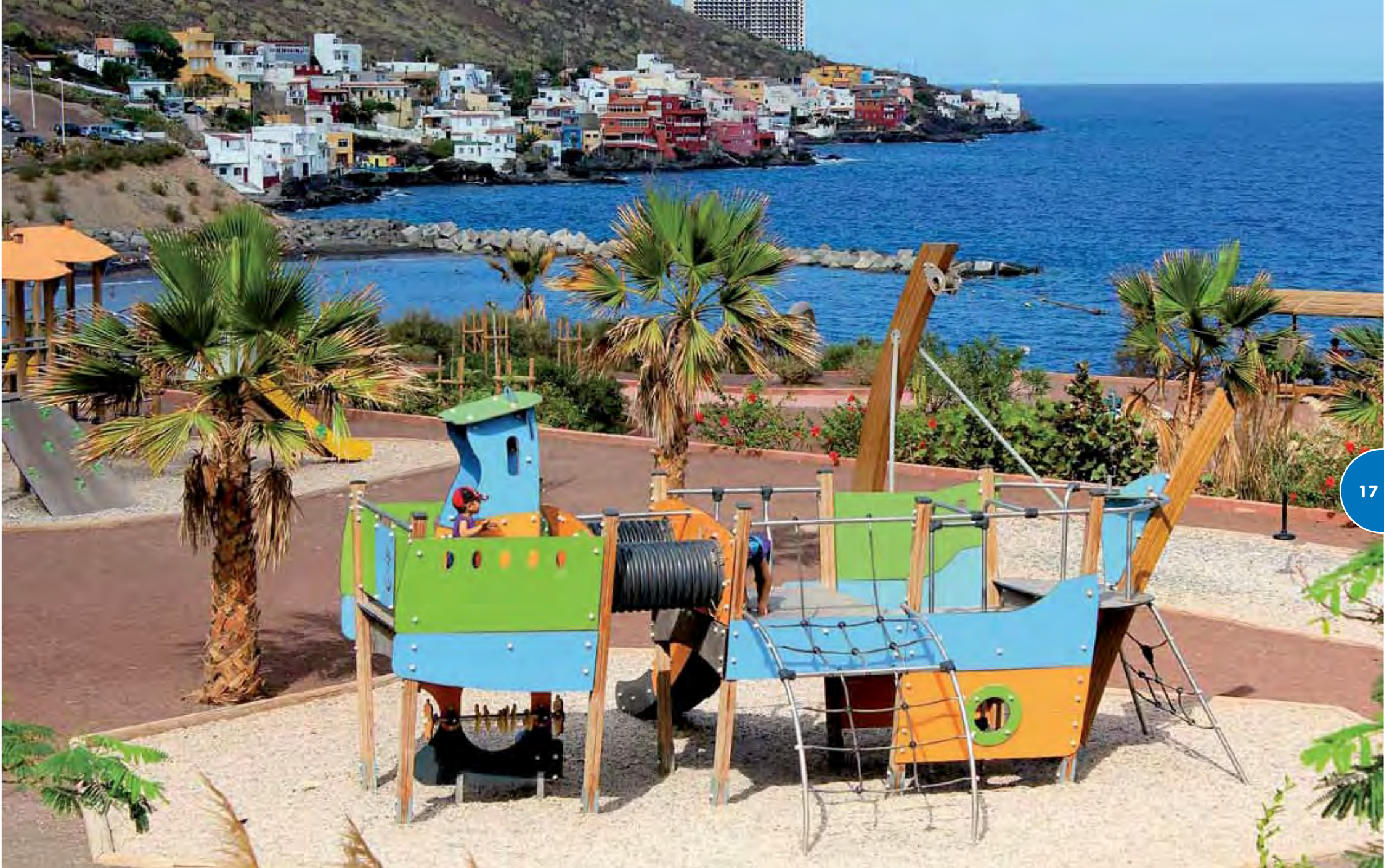
Speelterrein met een scheepsvlootstructuur, een Vivacity-structuur en een Kabelbaan.