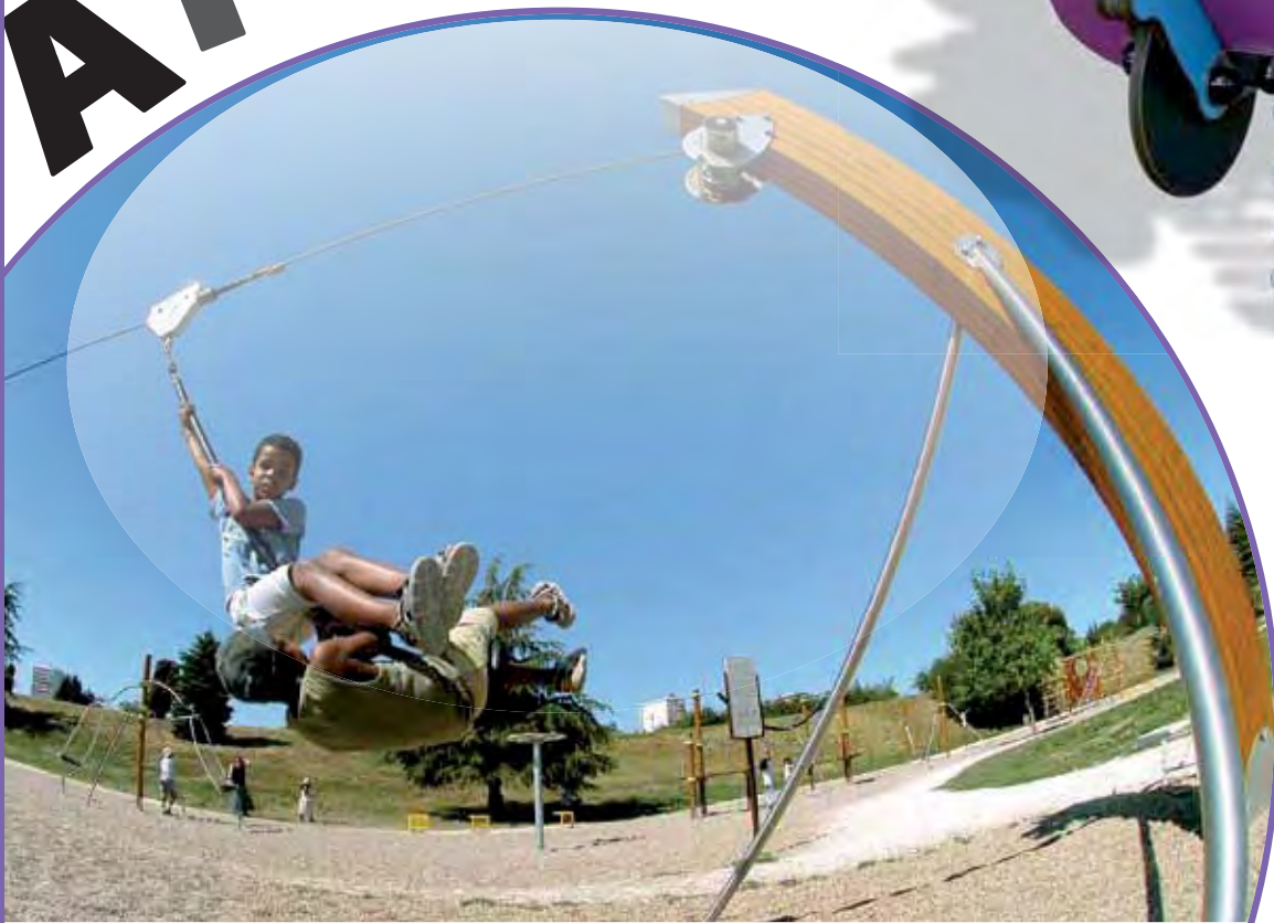
J510 - De kabelbaan voor een natuurlijke helling

De hechtheid van een jonge generatie, de familie en de gemeenschap, wordt bevorderd wanneer de speelrichting op gaat in de dynamiek van een kleine stad. Dit betekent dat men een levendige plek met speel- en sporttoestellen moet creëren die het gezamenlijk spelen stimuleren. De plek moet voor uitdagingen en vertier zorgen.