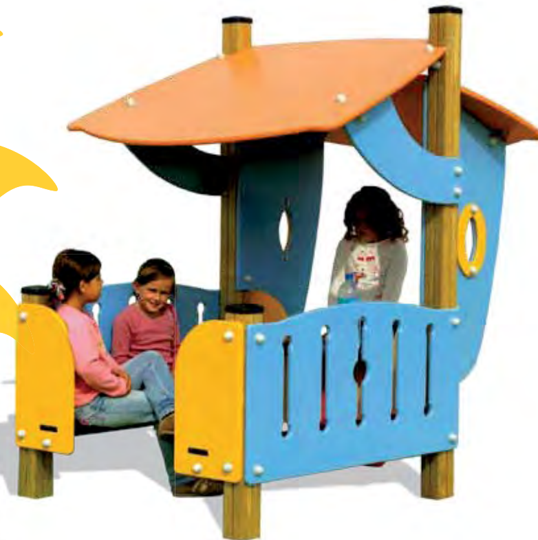
J262 - De bungalow

De getekende vormen zijn speels en de kleuren matchen met de producten.