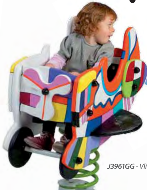
J3961GG - Vliegtuigje 'Grafic Games'

Hierdoor toont een speelruimte kracht en samenhang. Het bewijst dat het voorafgaand observeren van de locatie essentieel is voor het slagen van een ontwerp.