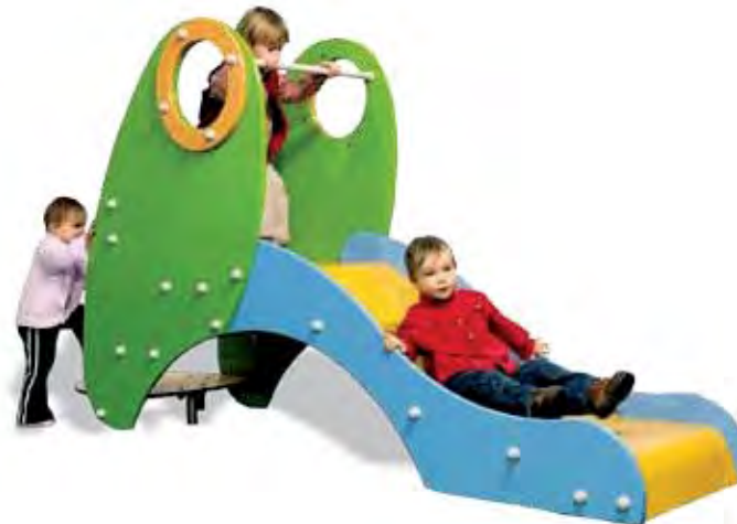
J3902 - De kleine glijbaan 'Tiboo'