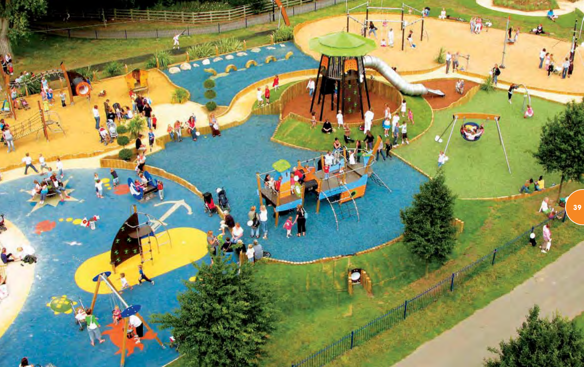
Speelterrein gerealiseerd met Kanopé-structuren, een scheepsvlootstructuur, loopbruggen, Bewegende toestellen en een Apollo-klimtoestel.