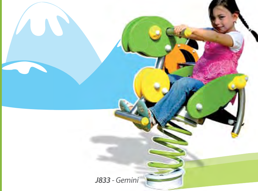
J833 - Gemini