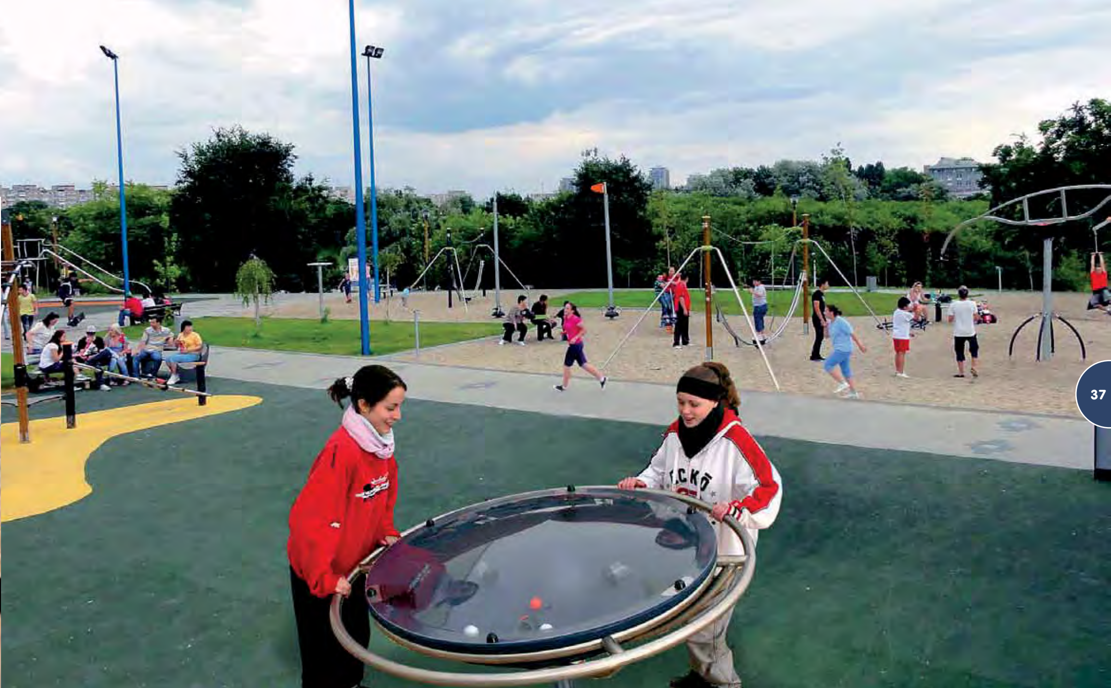
Sportterrein met Bewegende toestellen (Rodeoboard®, Altima®, Turnfly®, Skysurf®, Aéroskate®, Blue Bac Ball®).