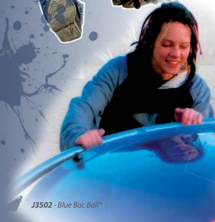
J3502 - Blue Bac Ball®

De Bewegende Toestellen bieden tal van sportieve mogelijkheden, zowel voor jongens als voor meisjes. Hoogte, snelheid, springen, draaien... de adrenaline is bij elk toestel aanwezig. De diversiteit van de aangeboden activiteiten maakt het mogelijk een volwaardige ruimte te creëren. Een bijeenkomst plaats voor interactie en communicatie.