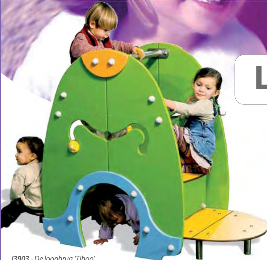
J3903 - De loopbrug 'Tiboo'