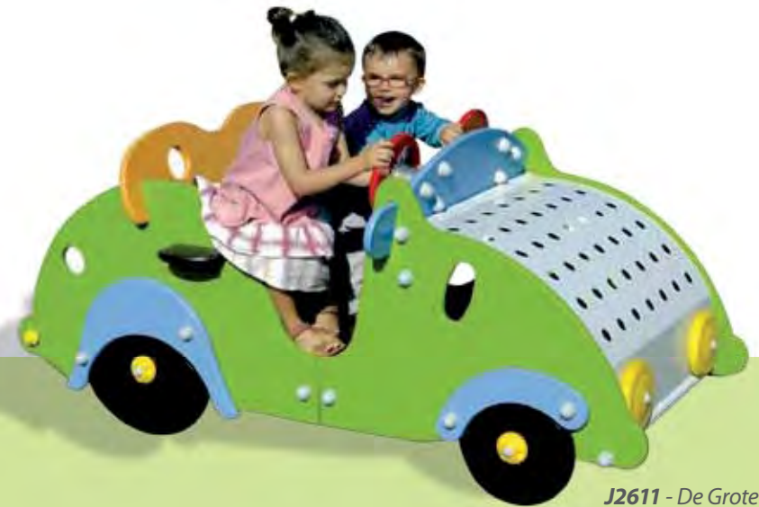
J2611 - De Grote Twiny