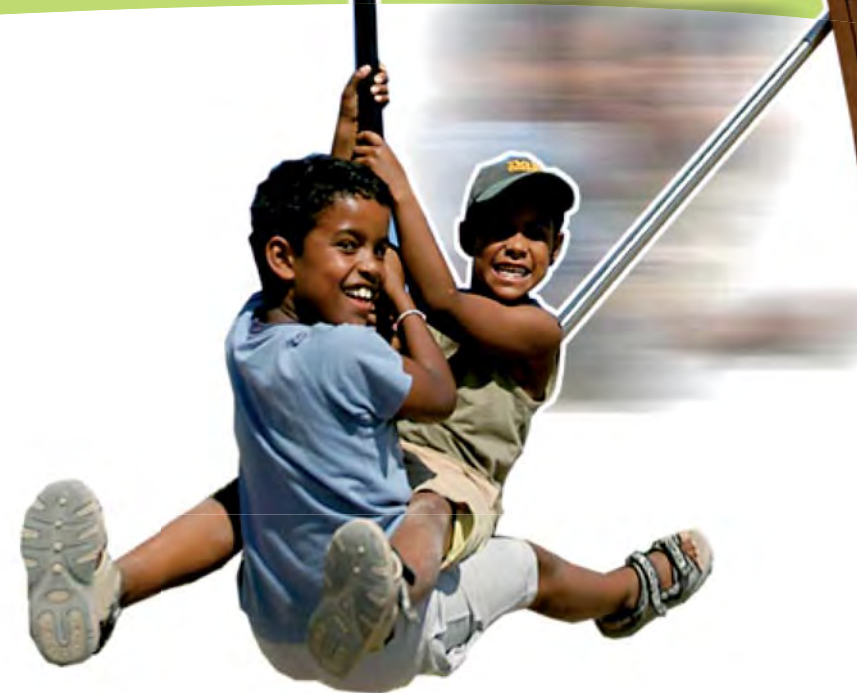
J511 - De kabelbaan voor een vlak terrein

De Kanopé-reeks bestaat uit houten materialen en asymmetrische vormen. Zij past volledig in een natuurlijke omgeving. De constructies geven een speelse, grafische twist aan de karakteristieken van grote bossen. Kinderen gaan helemaal op in deze buitengewone omgeving, terwijl ze plezier hebben met klimmen, klauteren, hangen en glijden. De kleuren, waarbij groen, oranje en bruin domineren, versterken de natuurlijke betekenis die aan het speelterrein is gegeven.