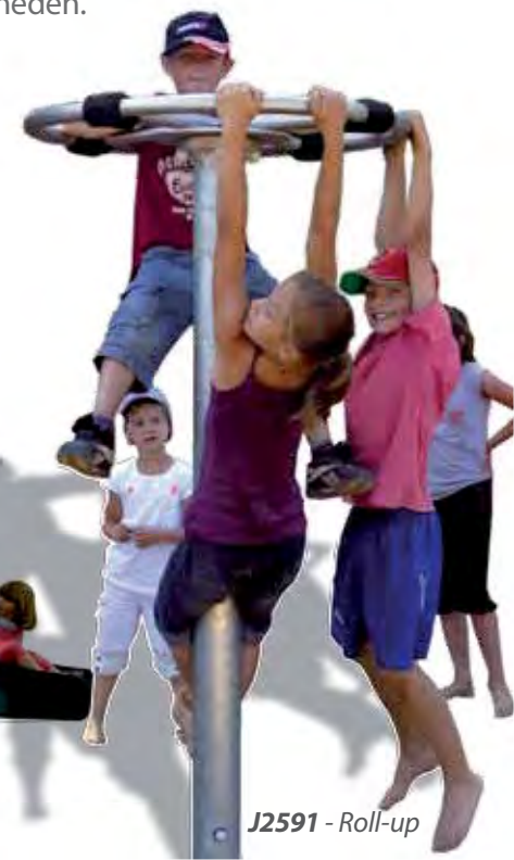
J2591 - Roll-up