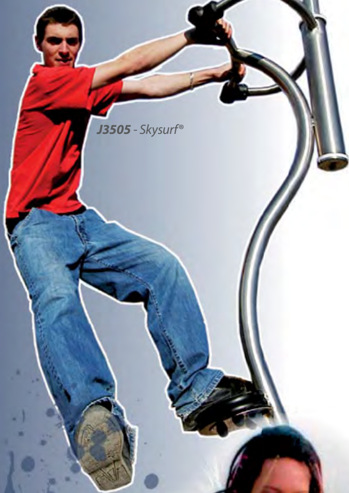
J3505 - Skysurf®

De sensatiesporten passen in zowel stedelijke- als speelse omgevingen. Zij bieden volwassenen en jongeren een eigen expressieruimte.