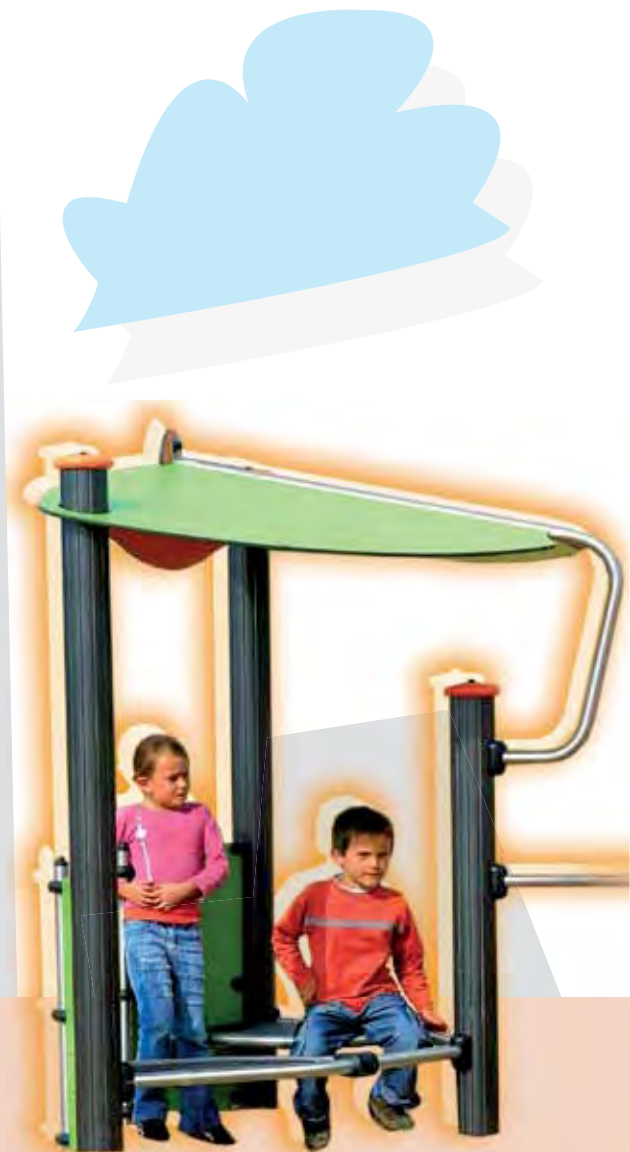
J275 - De clubhoek