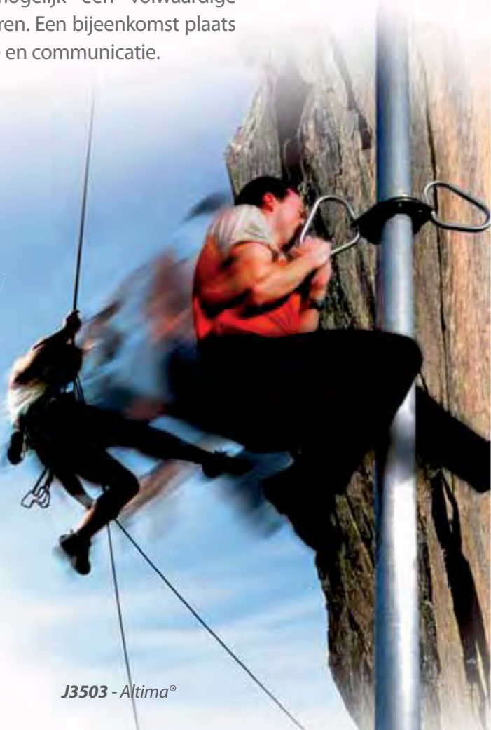
J3503 - Altima®