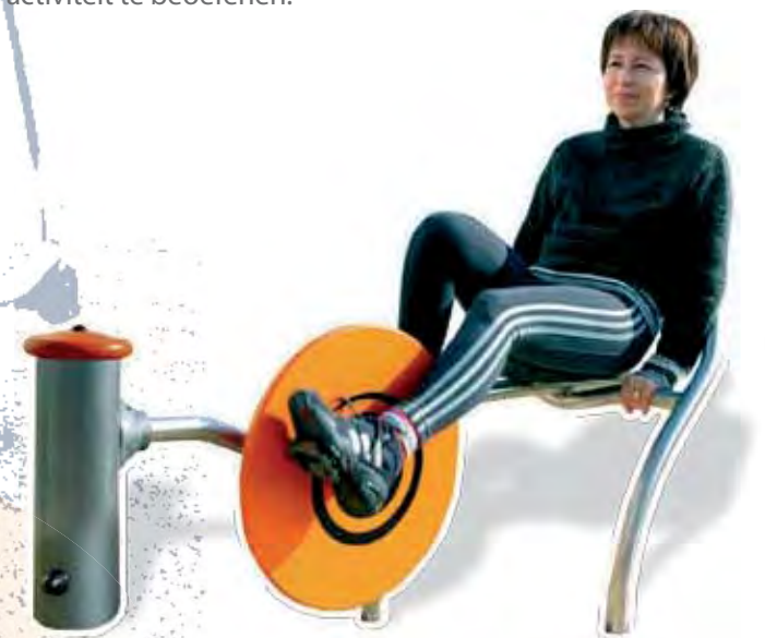
J3702 - Fiets