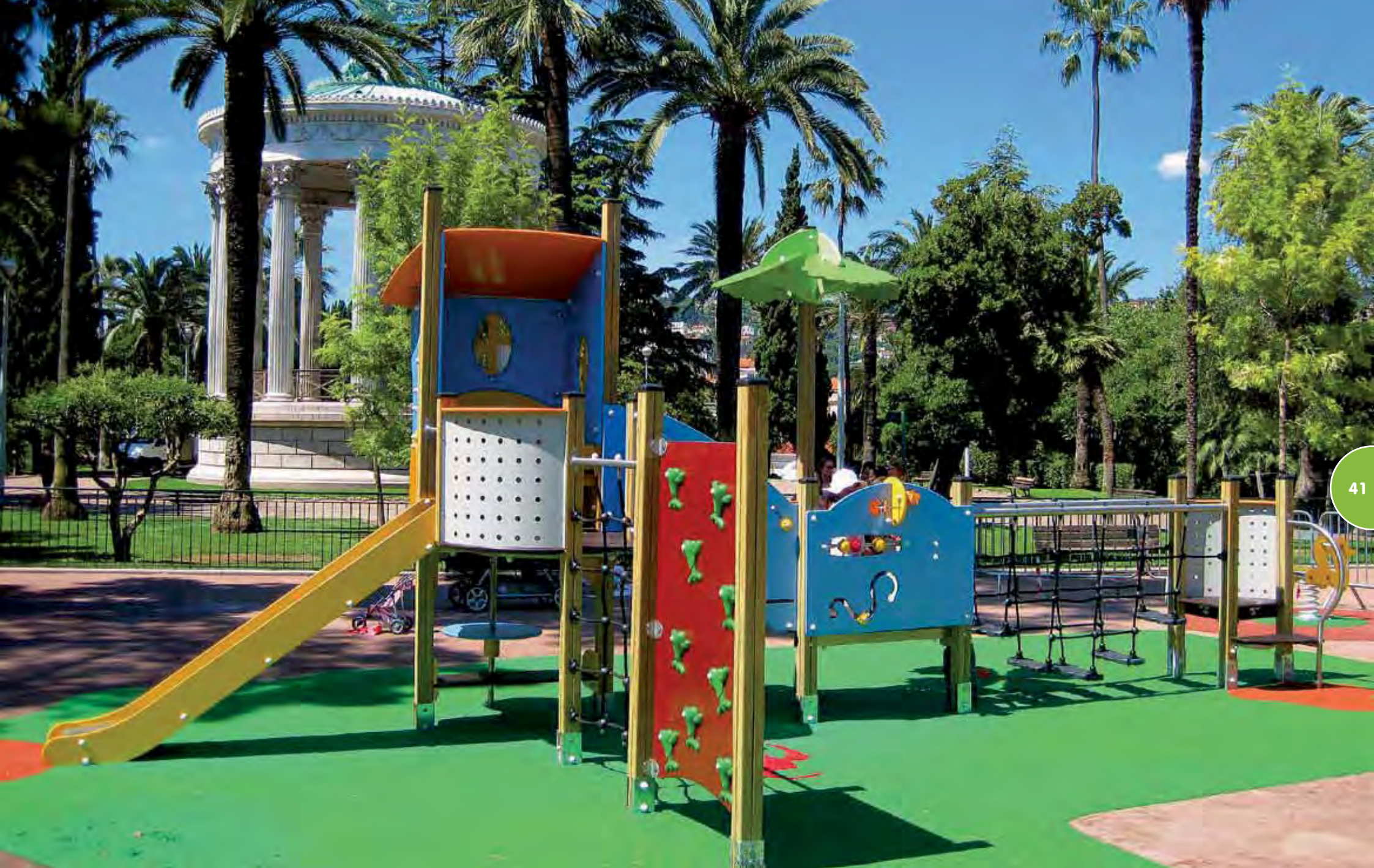
Speelterrein met een Vivarea-structuur.