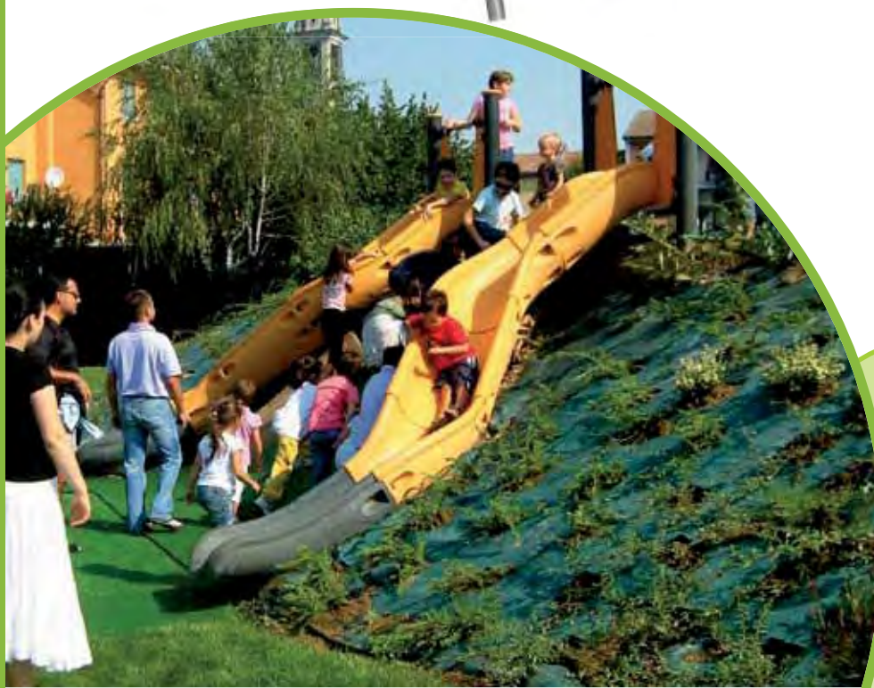
De Kayak glijbanen