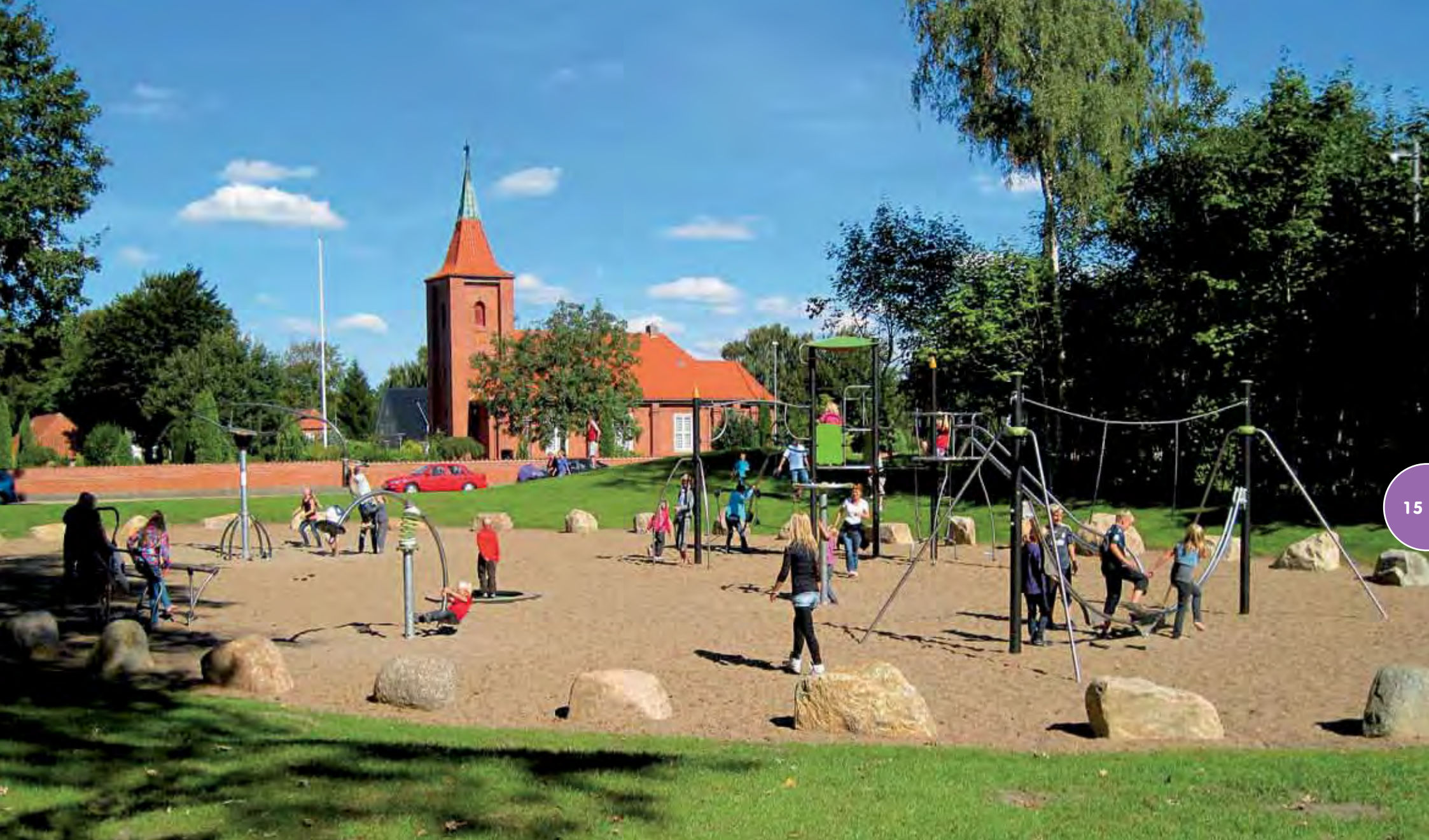
Speelterrein met een Biibox-structuur (Compacte versie), bewegende toestellen en een Hip Hop-draaitoestel.