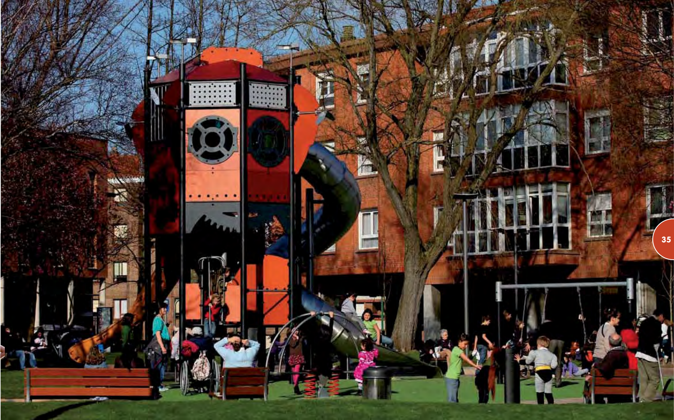
Speelterrein met een toren uit de reeks Fantasiesteden (Metropolis) en een metalen loopbrug.