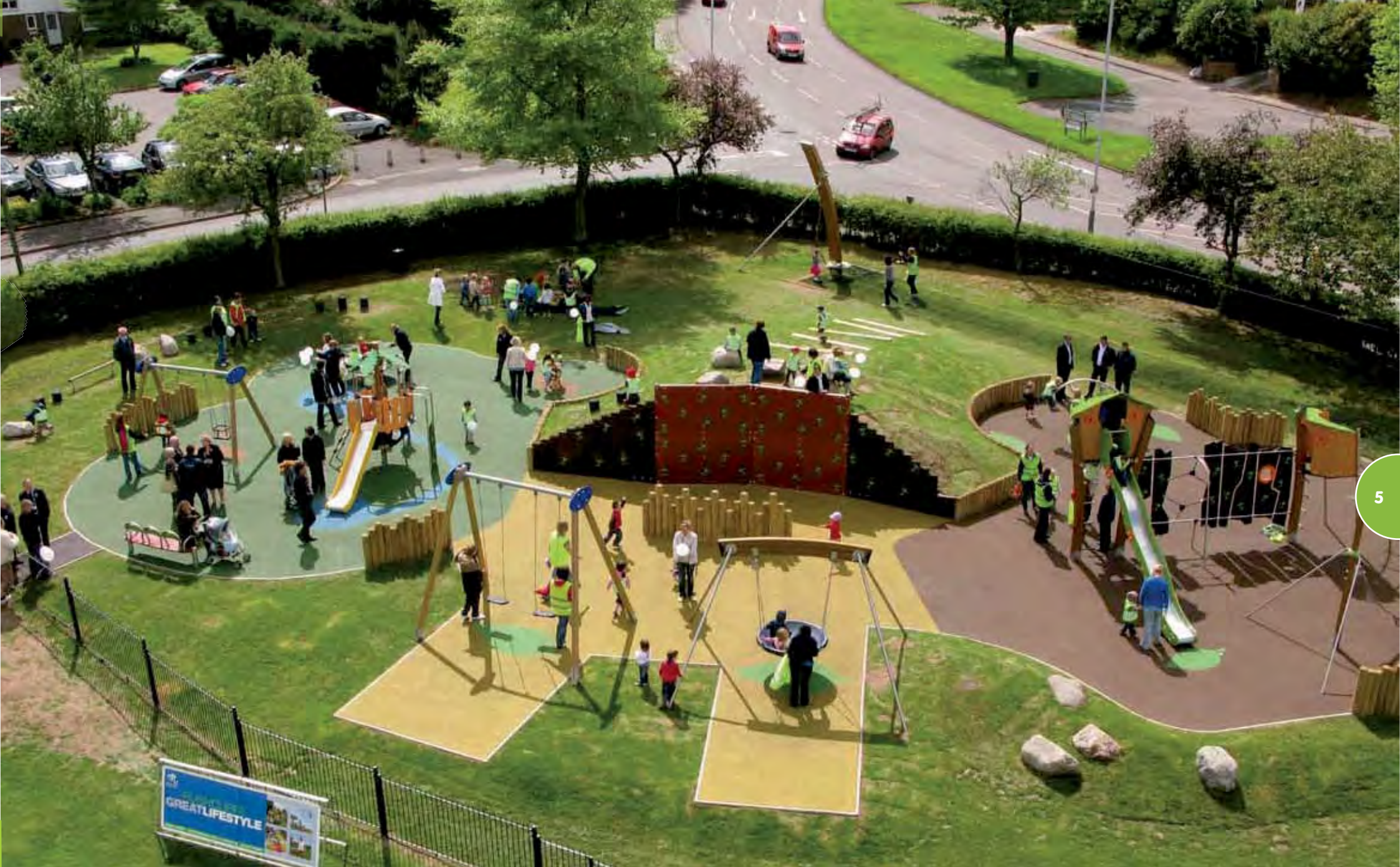
Speelterrein gerealiseerd met een Kanopé-structuur, loopbruggen, een Kabelbaan en een Tema Amazonia-structuur.