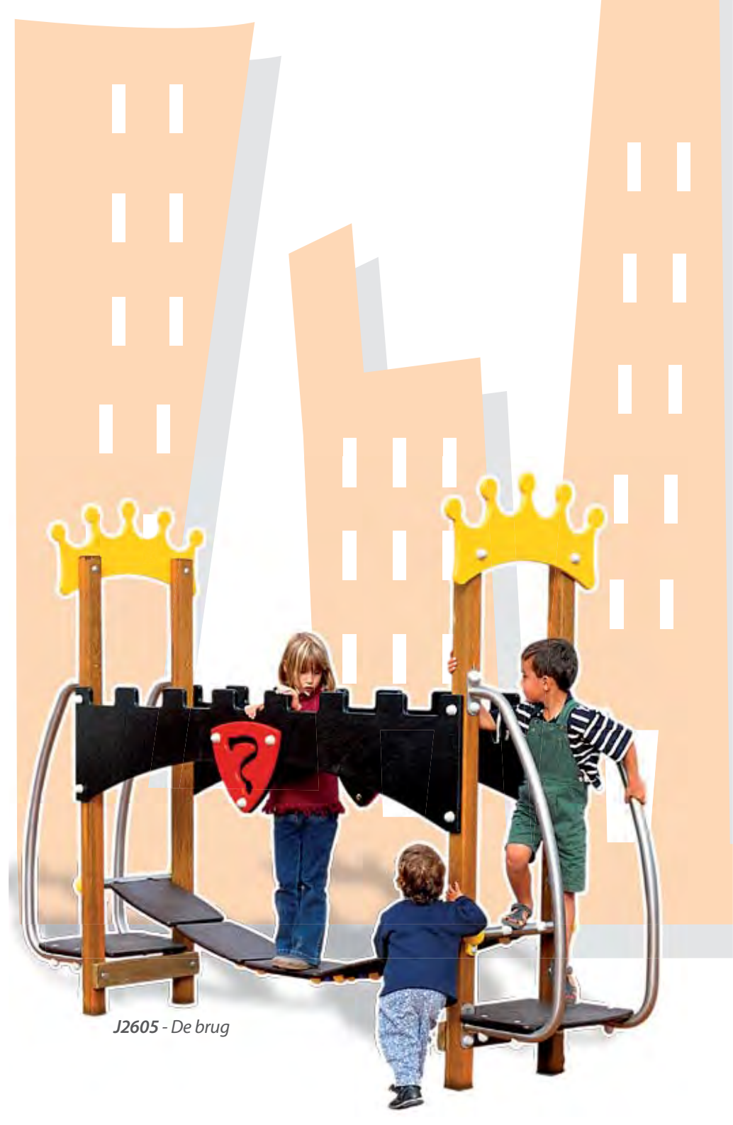
J2605 - De brug

De speelruimte is op zijn plaats zonder het architecturale evenwicht van de wijk te verstoren. Dit is het bewijs dat de samenkomst van tegengestelden kan worden toegepast op velerlei plekken.