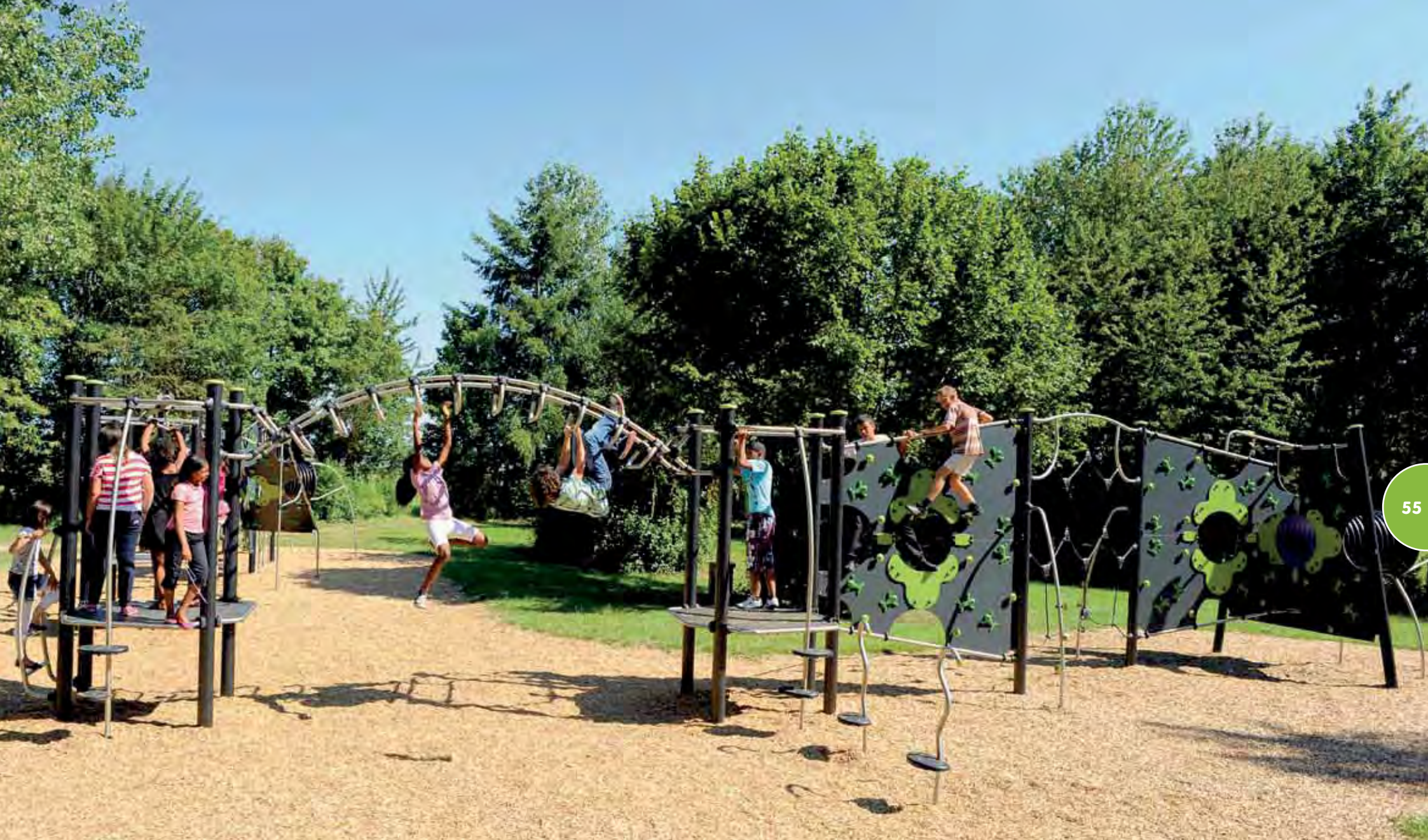
Speelterrein met een Verticale Wereld-structuur.