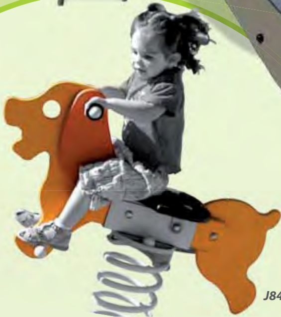
J840 - Dagobert