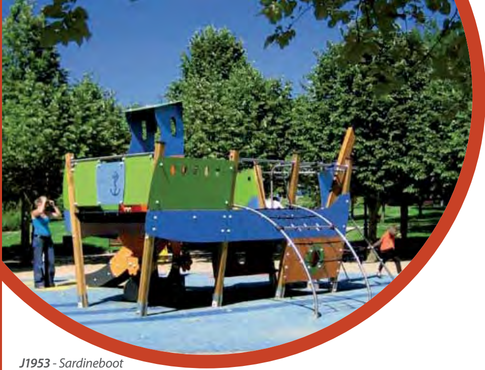
J1953 - Sardineboot