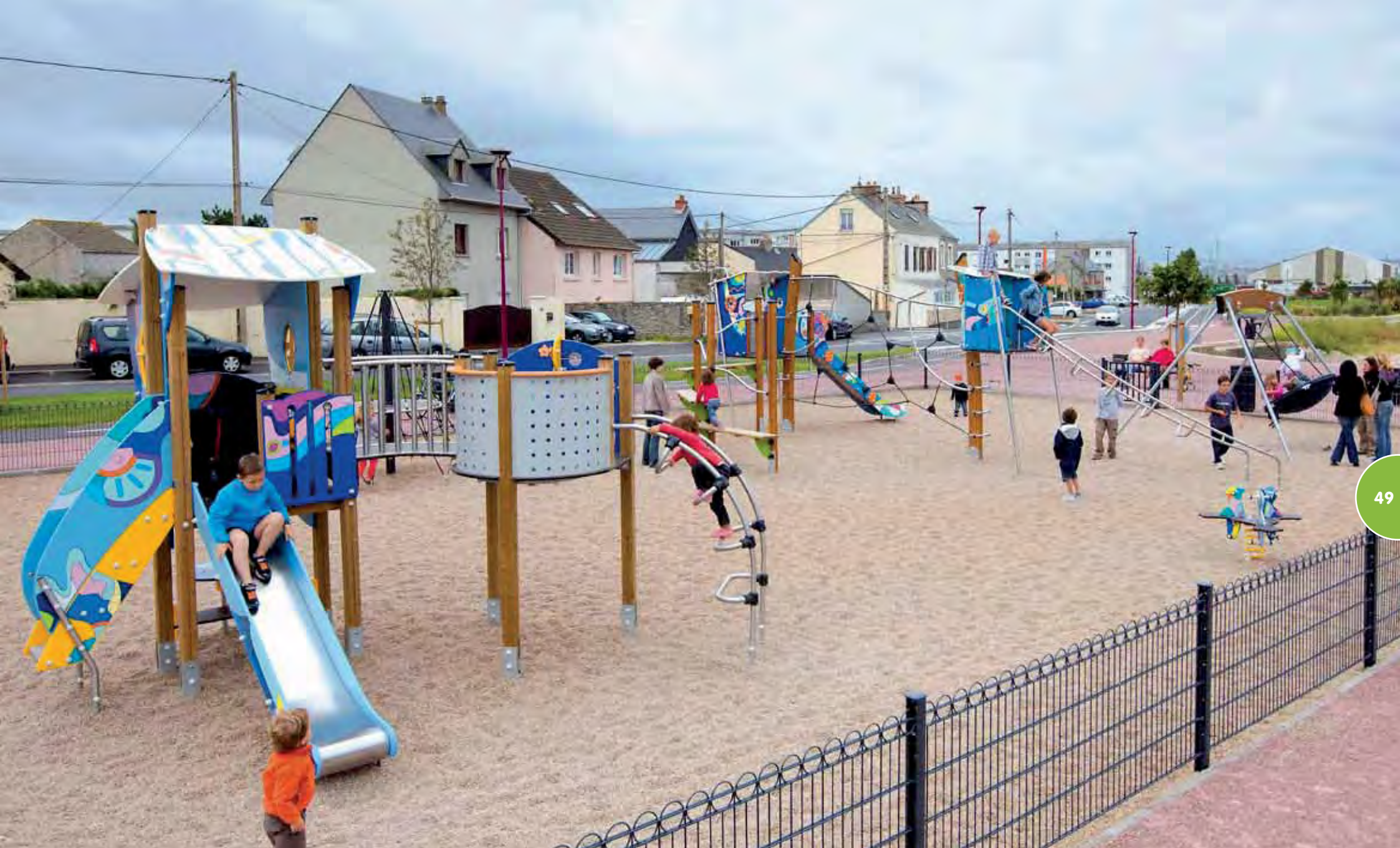
Speelterrein Grafic Games met versierde structuren in het thema Océane (Vivarea, Kanopé en een veertoestel). Er zijn ook een kleine Piramide en een schommelschuit te vinden.