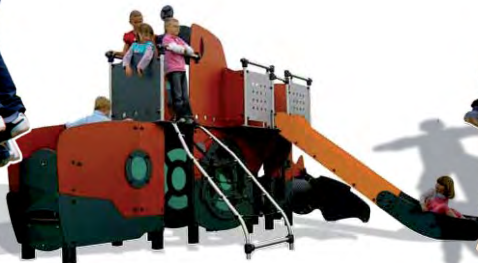
J47450 - Nautilus