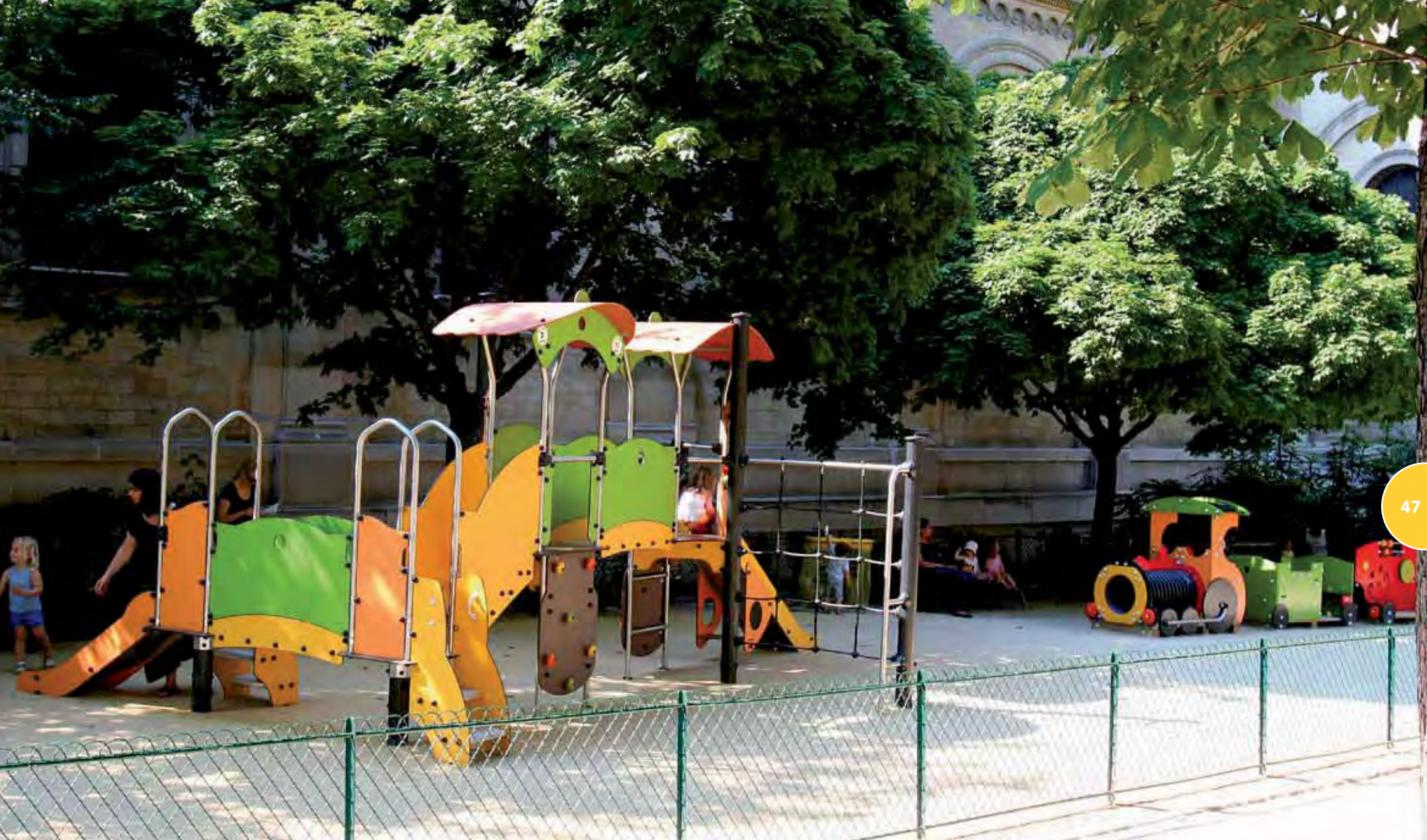
Speelterrein met een Diabolo-structuur en het thematische Trein toestel.