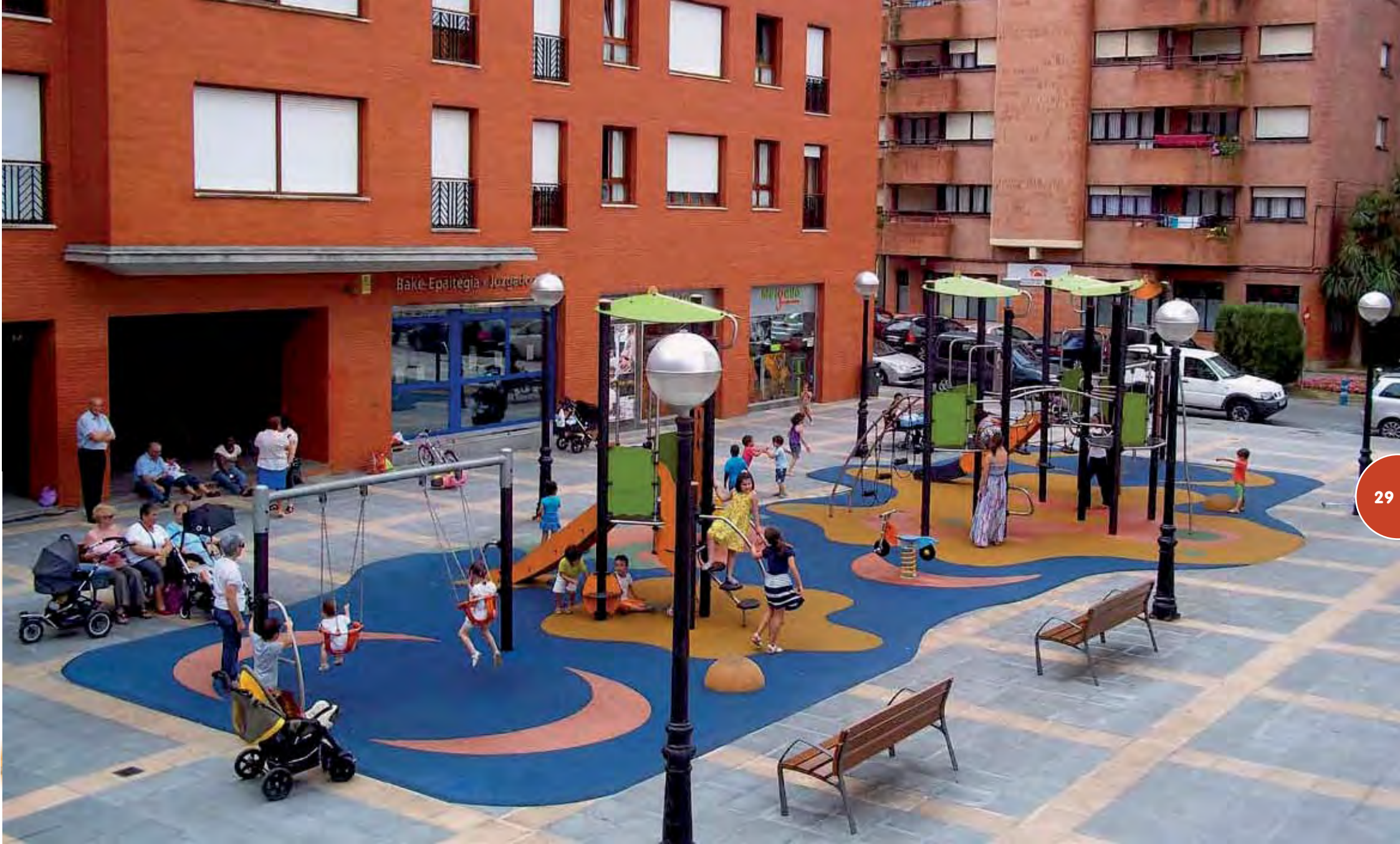
Speelsterrein met een Biibox-constructie (Compacte versie), een metalen loopbrug en veertoestellen.