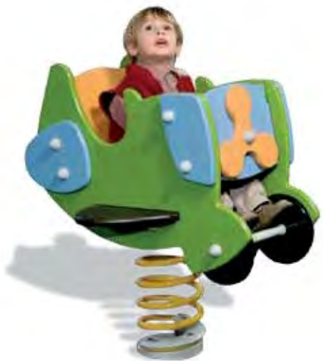
J3961 - Vliegtuigje

Een speelterrein creëren voor meerdere generaties betekent de ruimte indelen met duidelijk herkenbare speel-, sport- en ontspanningsruimtes. Zij moeten dicht genoeg bij elkaar liggen om het contact tussen de gebruikers te vergemakkelijken, de communicatie tussen hen te stimuleren en hen in staat stellen om gezamenlijk dingen te ondernemen.