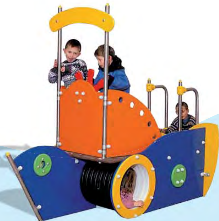
J2604 - Calypso

De zee en boten zijn een voorbeeld van thematisch en visueel samengaan. De speelruimte met de vissersboot aan de kust wordt geheel opgenomen in het lokale landschap en -leven. Kinderen doen alsof ze groot zijn. Ze beleven plezier met zorgvuldig ontworpen toestellen. Deze hebben een moderne look en brengt hen via de eigen fantasie naar het midden van de oceaan waarop ze uitzicht hebben.