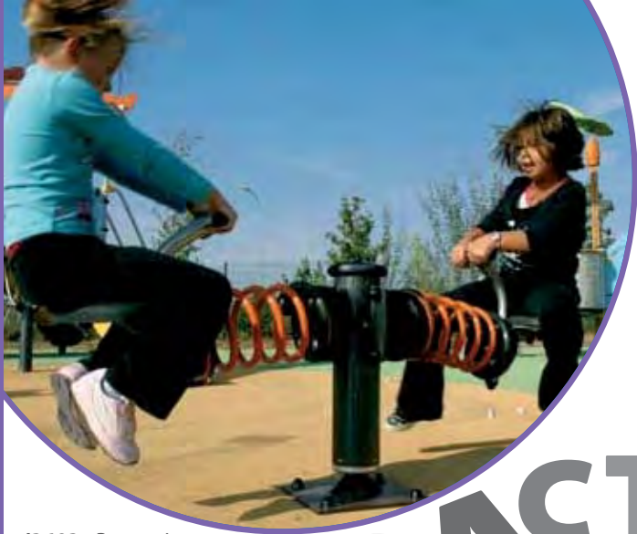
J3603 - Rotatwin