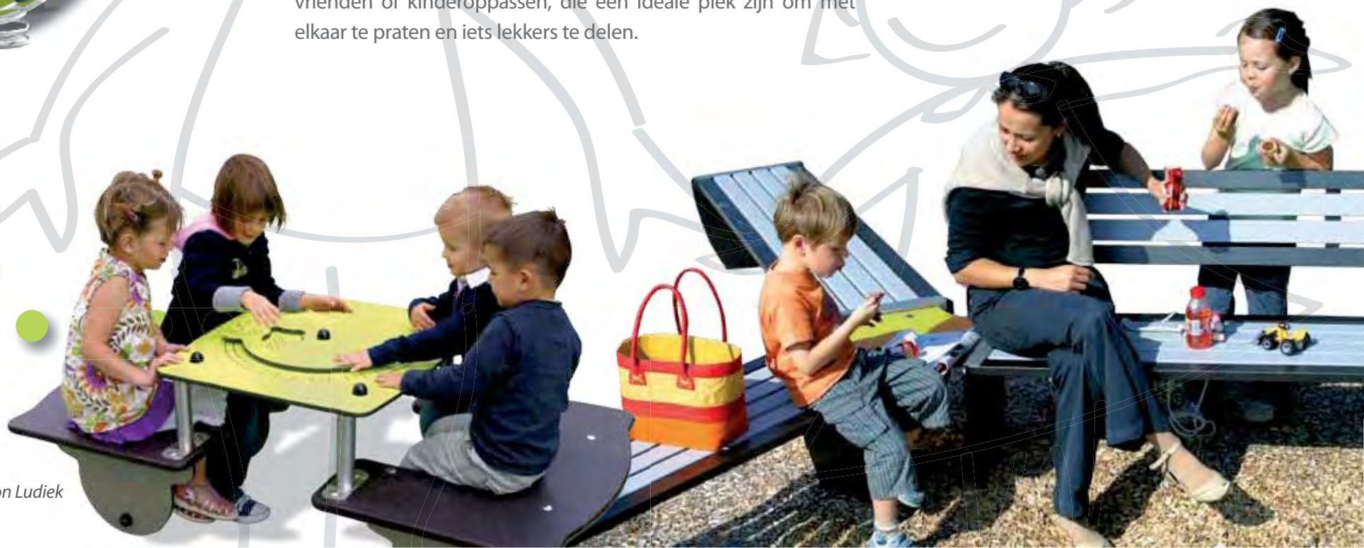
J2619 - Trein Wagon Ludiek

De gebruikersvriendelijkheid wordt versterkt door de aanwezigheid van meubilair. Er zijn banken en tafels voor ouders, vrienden of kinderoppassers, die een ideale plek zijn om met elkaar te praten en iets lekkers te delen.