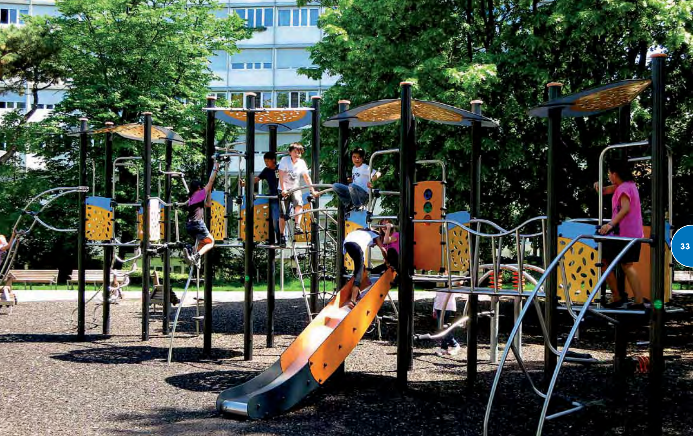
Speelsterrein met een Biibox-structuur (Aluminium versie).