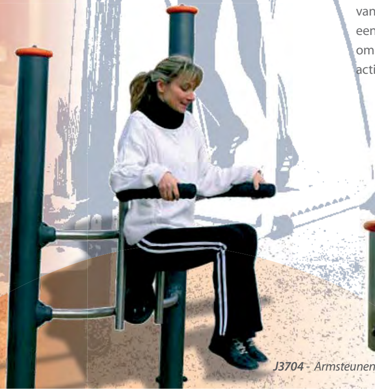
J3704 - Armsteunen

Elke structuur is voorzien van een speciale bewegwijzering. Deze informeert de gebruiker over de moeilijkheidsgraad van de aangeboden activiteiten. Daarnaast zijn de borden een handvat voor incidentiele en ervaren sportbeoefenaars, om op zelfstandige wijze en in alle veiligheid een sportieve activiteit te beoefenen.