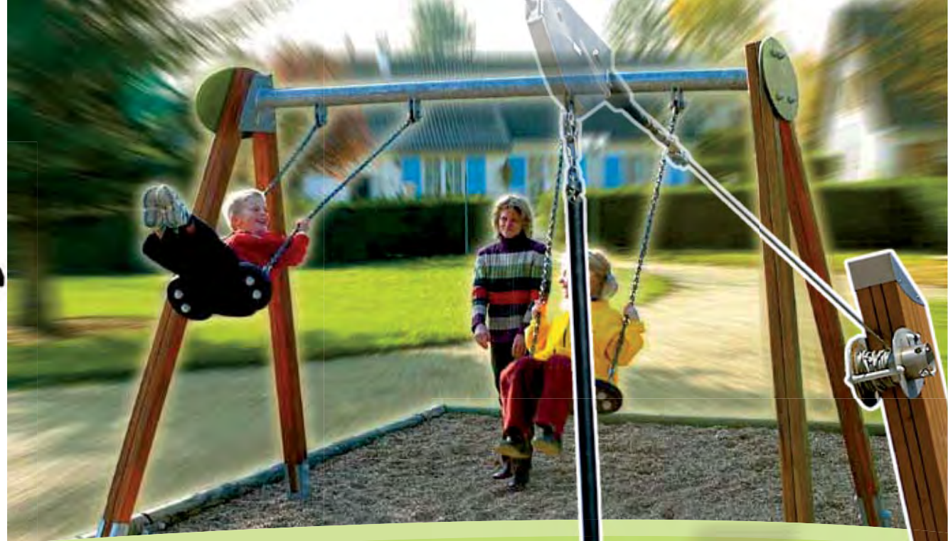
J450 - Schommels / Multiplexhout