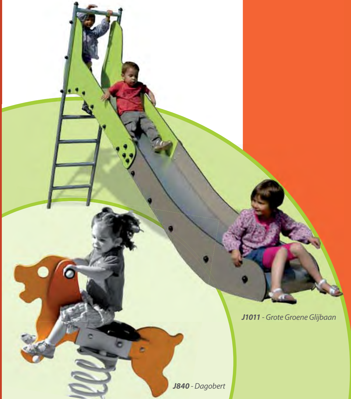
J1011 - Grote Groene Glijbaan

De grafische afbeeldingen op de vloeren spelen een grote rol bij de inrichting van de ruimte. Ze zijn zowel een visueel herkenningsteken als een speels element. Zij benadrukken de lay-out, voegen kleur toe en onderstrepen het thema van de ruimte. Ze zijn onderdeel van de inrichting en maken haar aantrekkelijker.