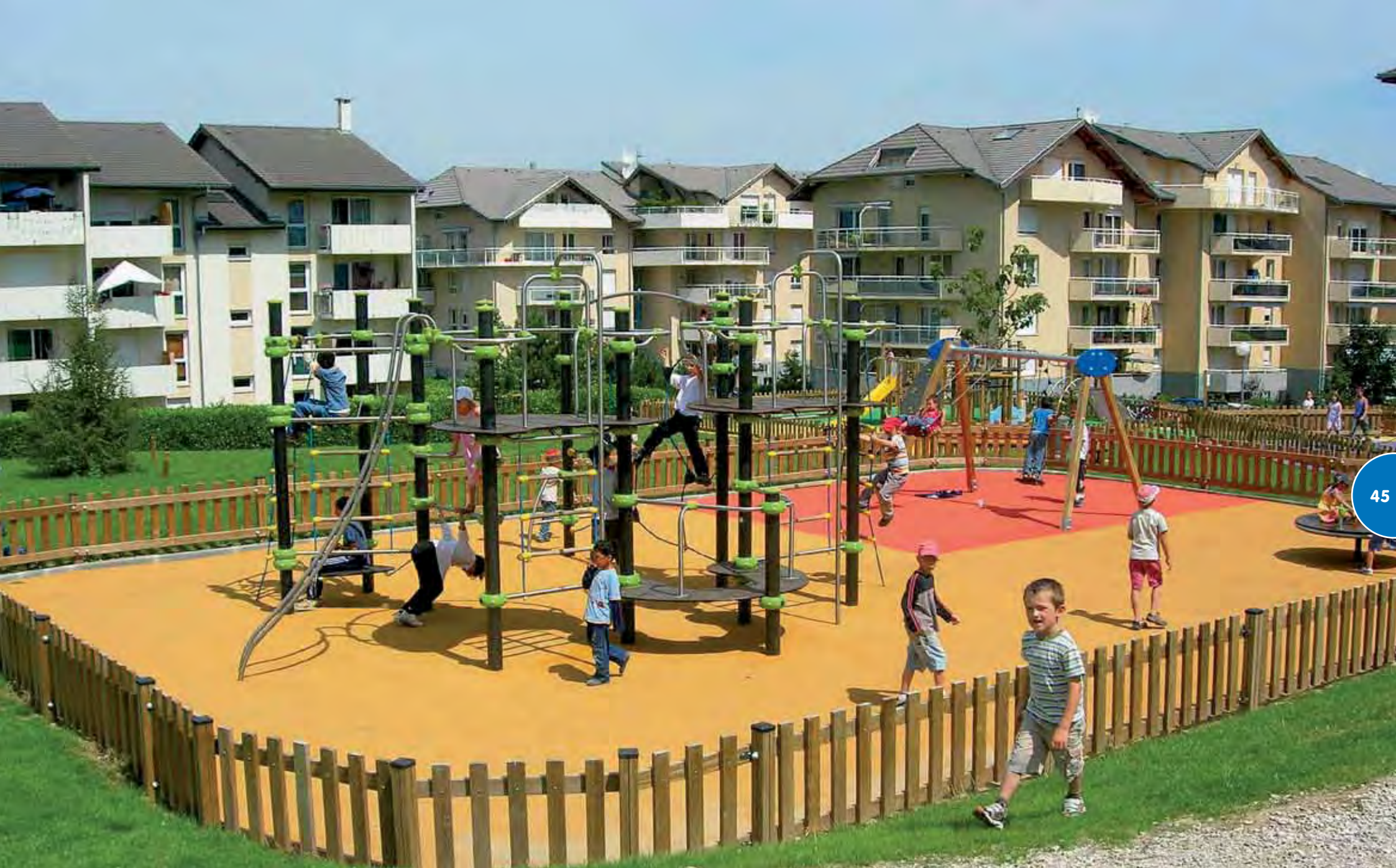
Speelterrein gerealiseerd met een Ixo Métal -structuur, klassieke toestellen en een Gyro speed-draaischijf.