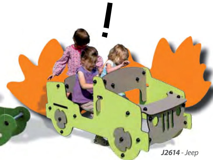
J2614 - Jeep