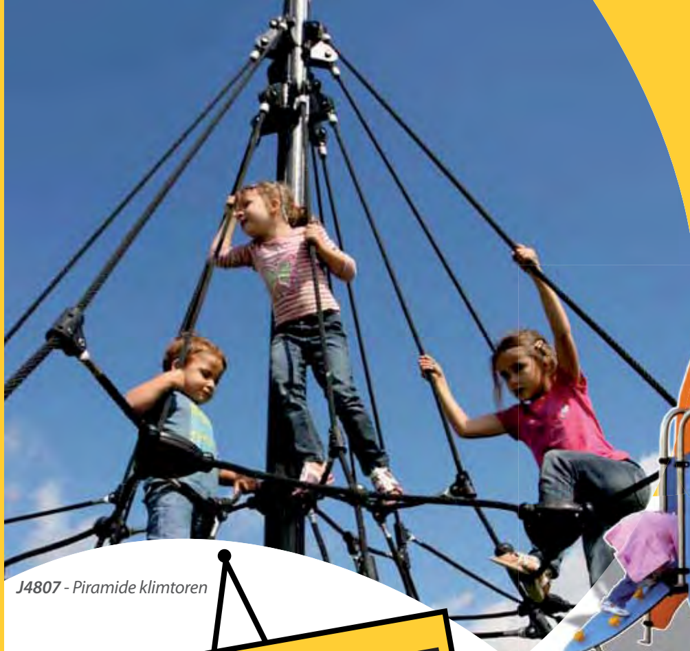
J4807 - Piramide klimtoren