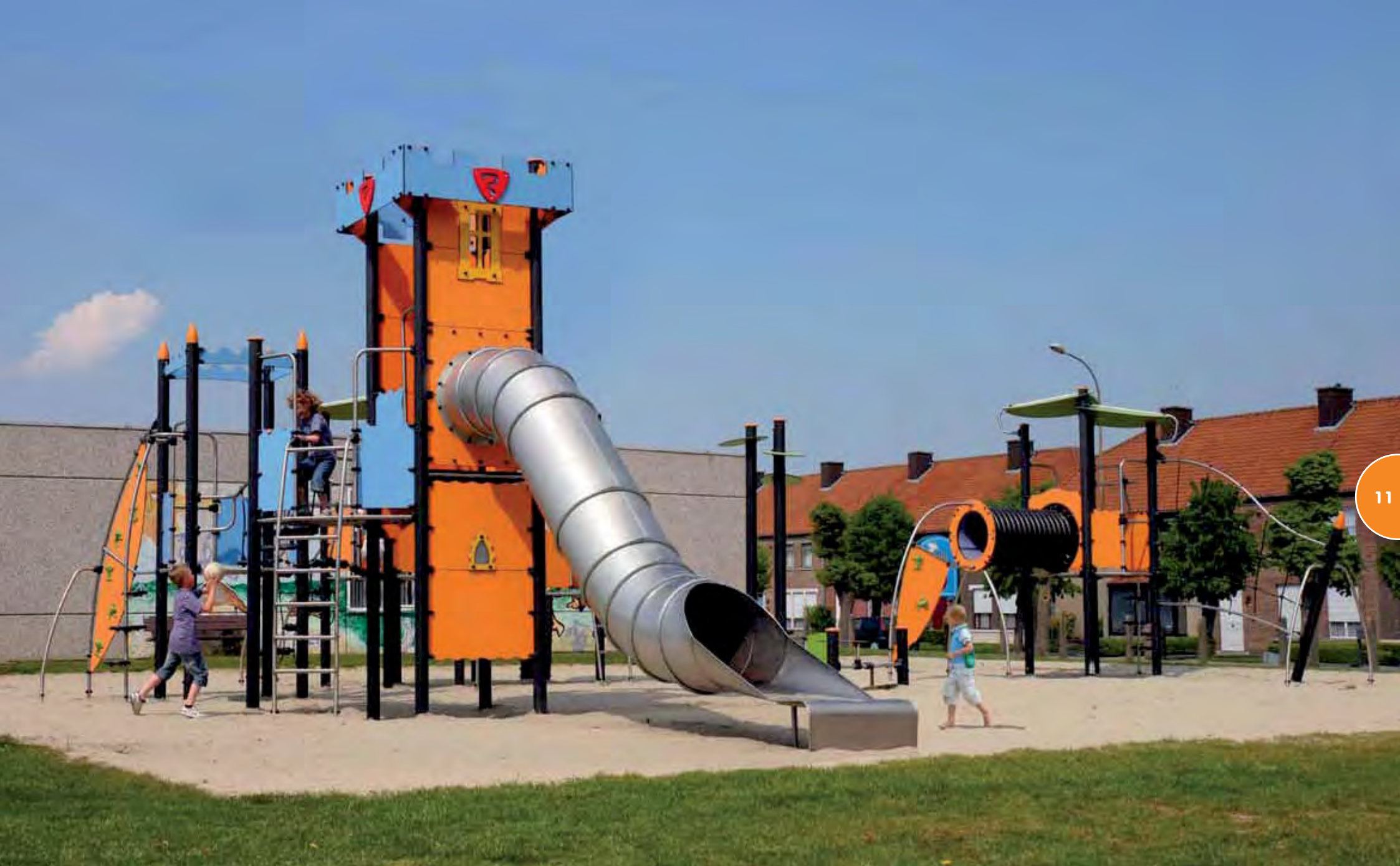
Beveren-Leie - België Speciaal project.