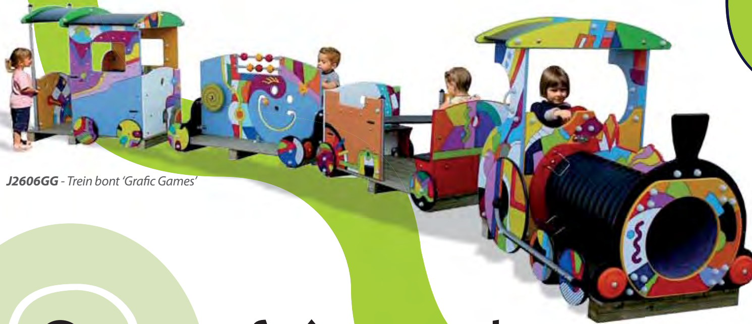
J2606GG - Trein bont 'Grafic Games'