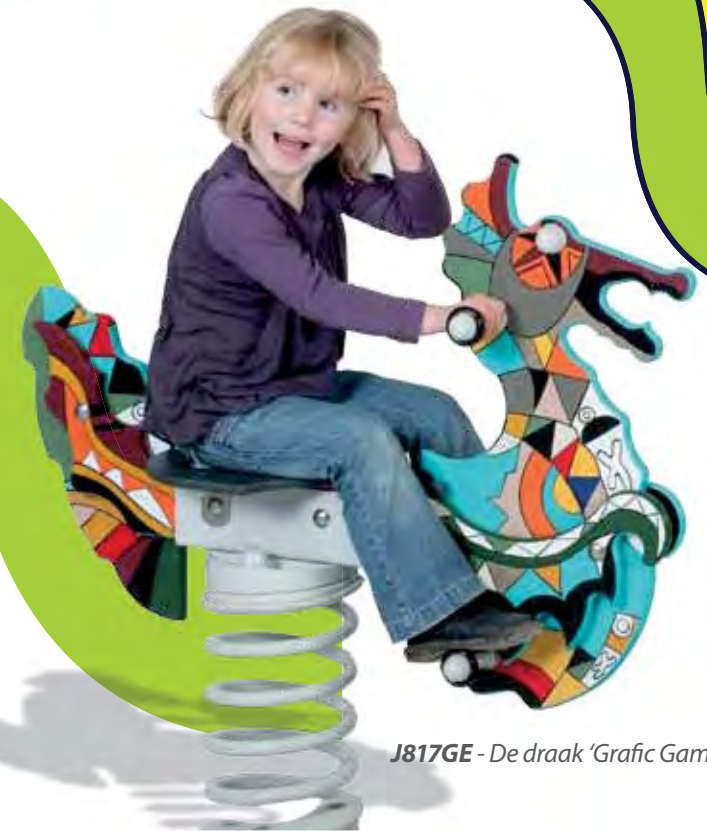
J817GE - De draak 'Grafic Games'