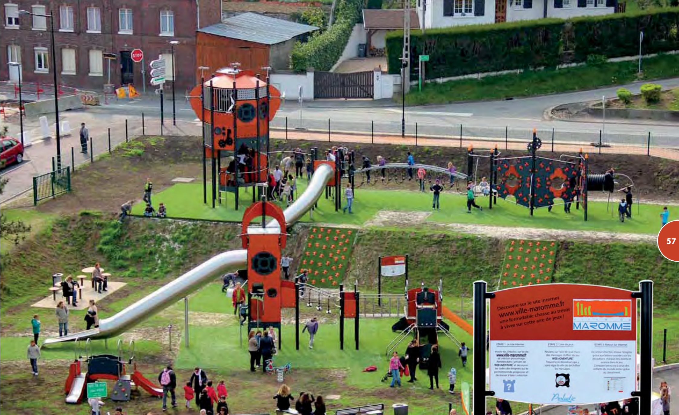
Speelterrein gerealiseerd met verschillende Metropolis-structuren van de reeks Fantasiewerelden (achthoekige toren, vierkante toren, Verticale Wereld, Nautilus). Verlevendigd met het Web Adventure-toestel.