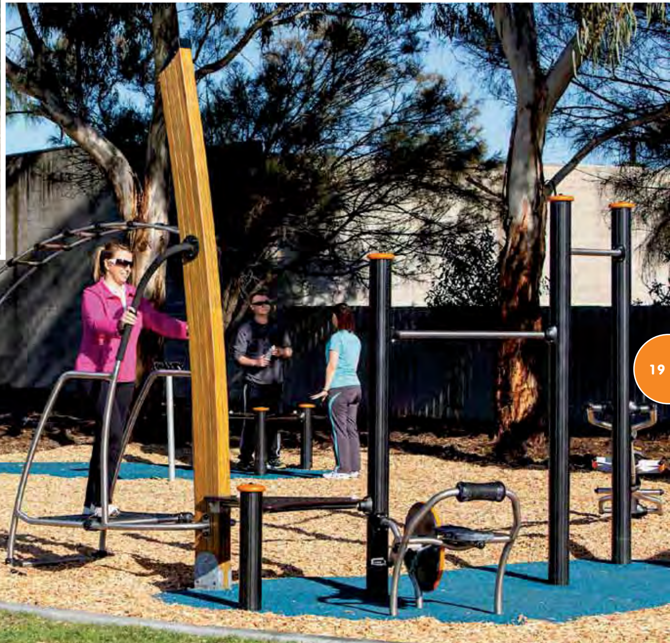
Sportterrein met elementen van Vitaliteitparcoursen®.