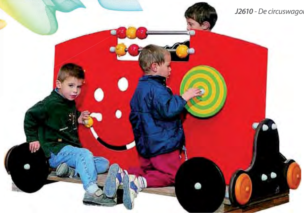
J2610 - De circuswagon