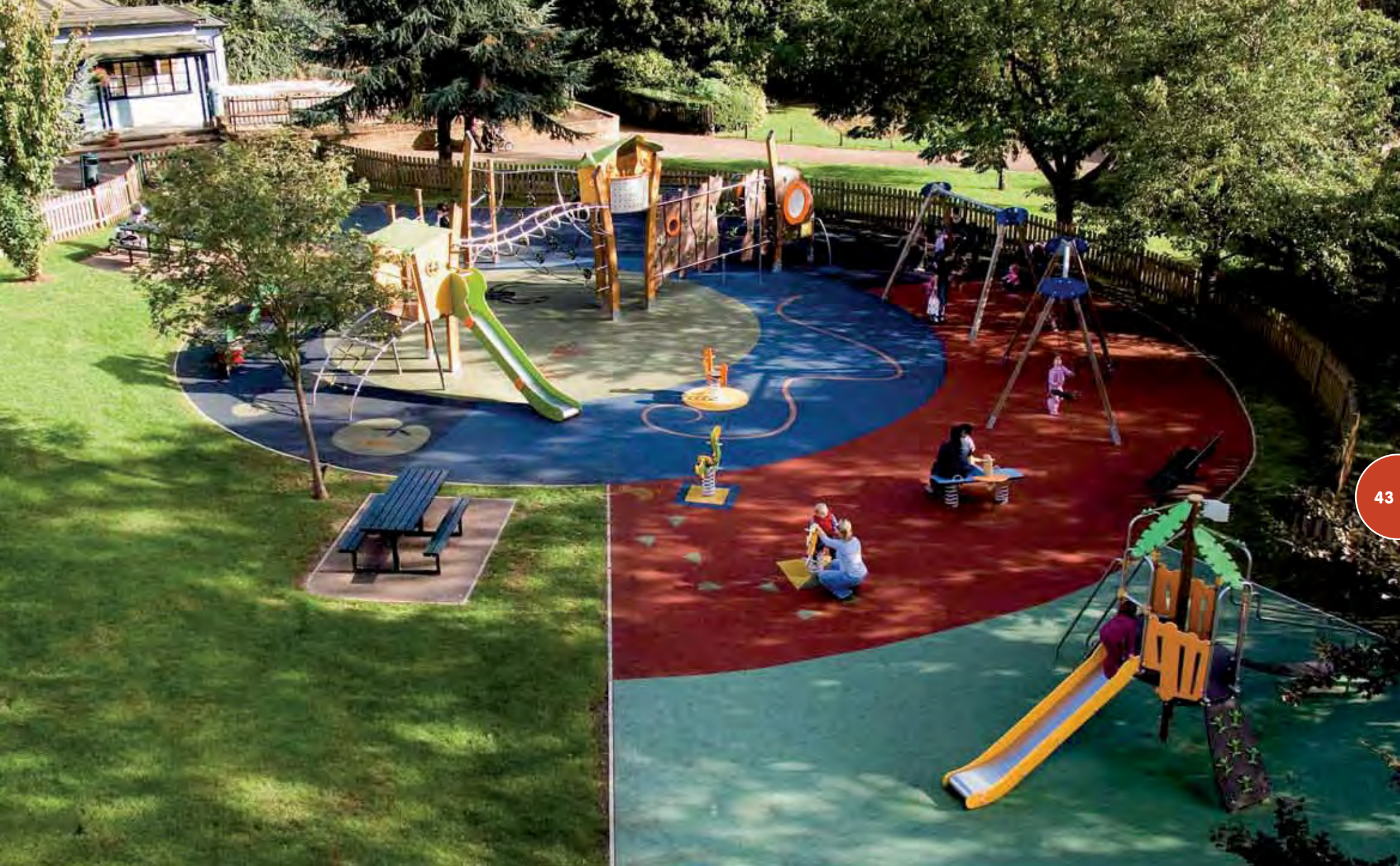
Speelterrein met een Kanopé-structuur, loopbruggen, veertoestellen en een Tema Amazonia-structuur.