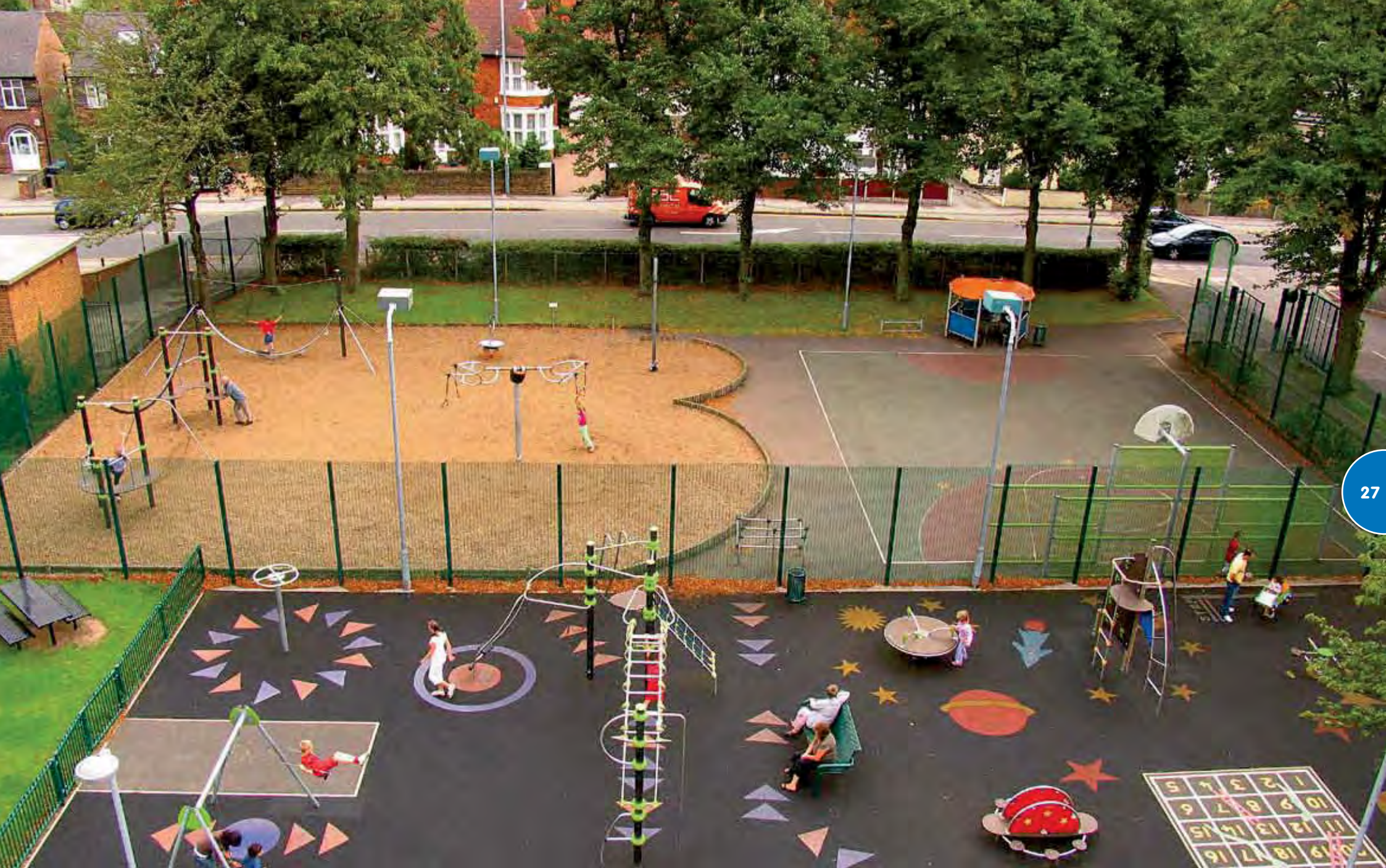
Speelterrein gerealiseerd met een Ixo-structuur, een Apollo-klimtoestel, diverse klassieke toestellen en draaitoestellen (1e project); bewegende toestellen, een groot Multisportveld en een Ontmoetingsplek (achterste project).