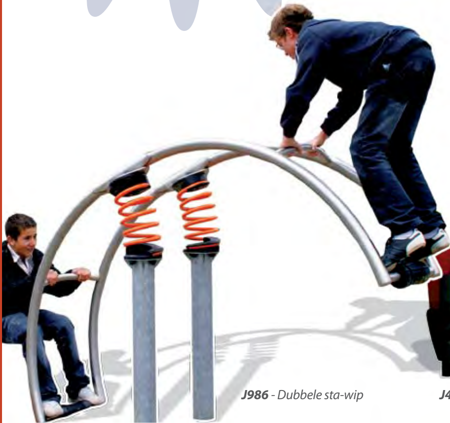
J986 - Dubbele sta-wip

Deze constructie heeft een imponerende hoogte en omvang en is een belevenis op zich in het hart van de stad. Het brengt kinderen naar een andere tijd en biedt talrijke spel- en fantasiemogelijkheden.