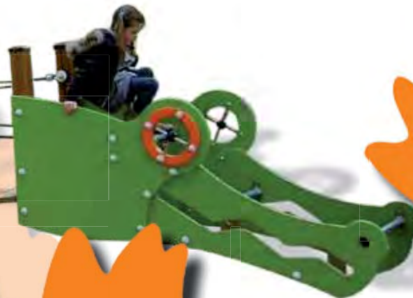
J2771 - Croco