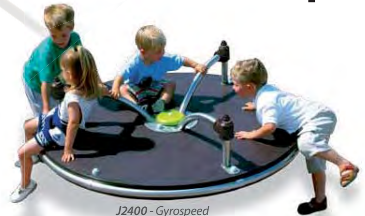
J2400 - Gyrospeed