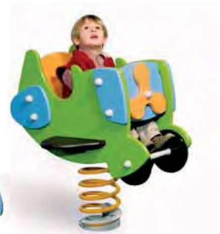
J3961 - Vliegtuigje 'Tiboo'