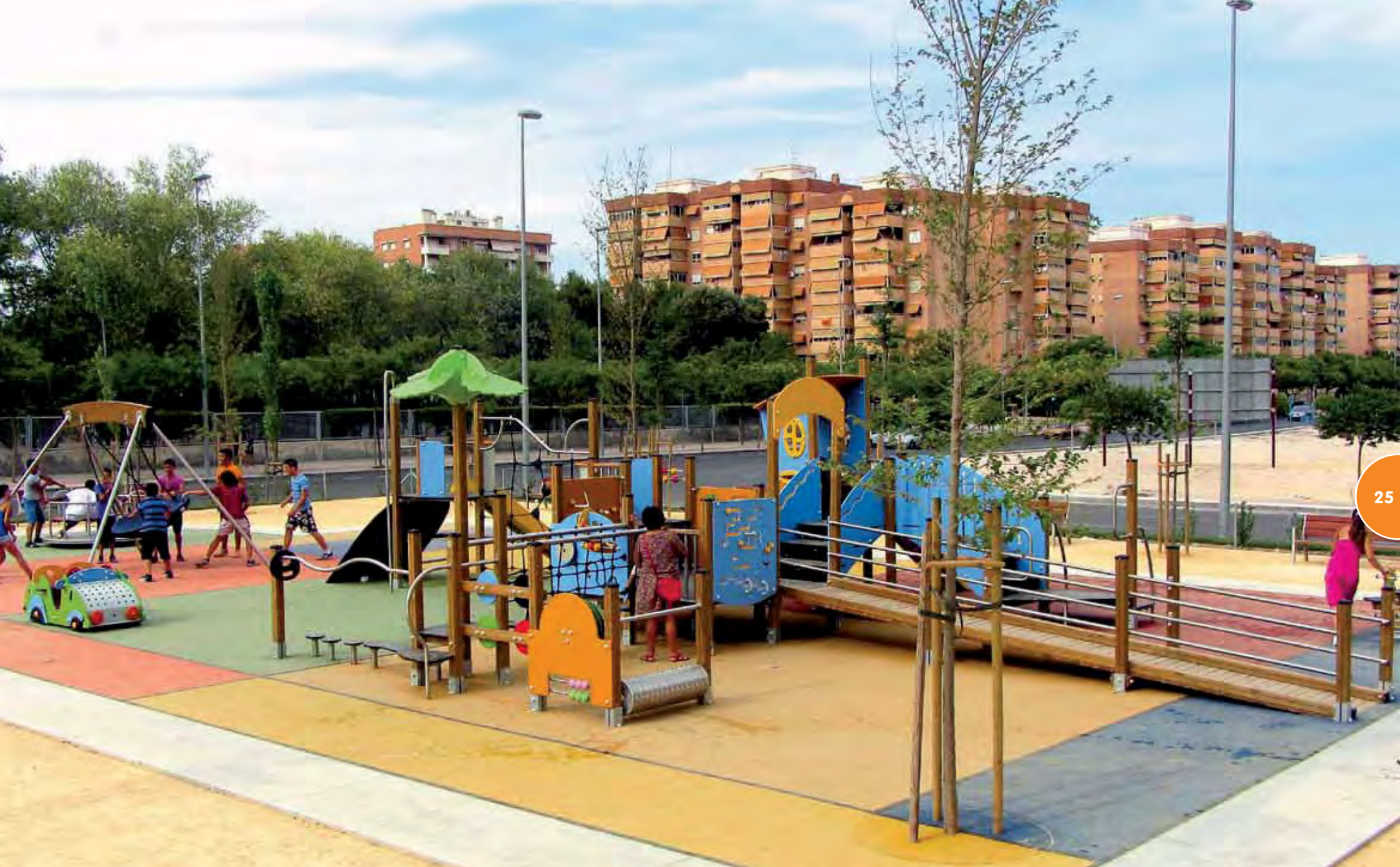
Speelsterrein met een Vivarea-structuur, een schommelschuit en het thematische toestel De Grote Twiny.