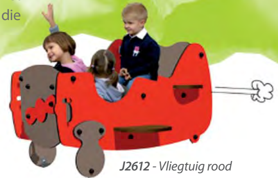
J2612 - Vliegtuig rood