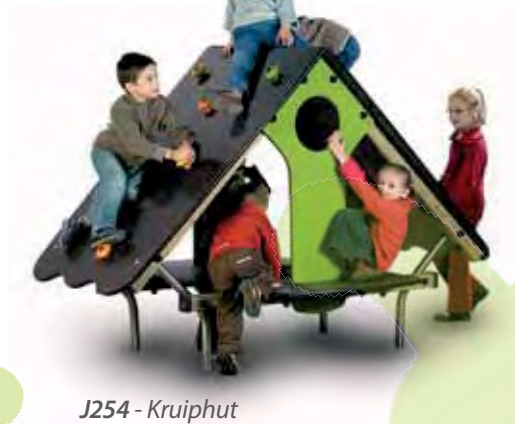
J254 - Kruiphut

Gebruik maken van de bestaande omgeving, ruimtes opnieuw aanpassen, spelen met hoogteverschillen, rekening houden met afbakening... Dit betekent dat in de ontspanningsruimte landschapsarchitectuur wordt toegepast.