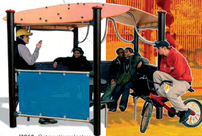
J2860 - Ontmoetingsplaatsen