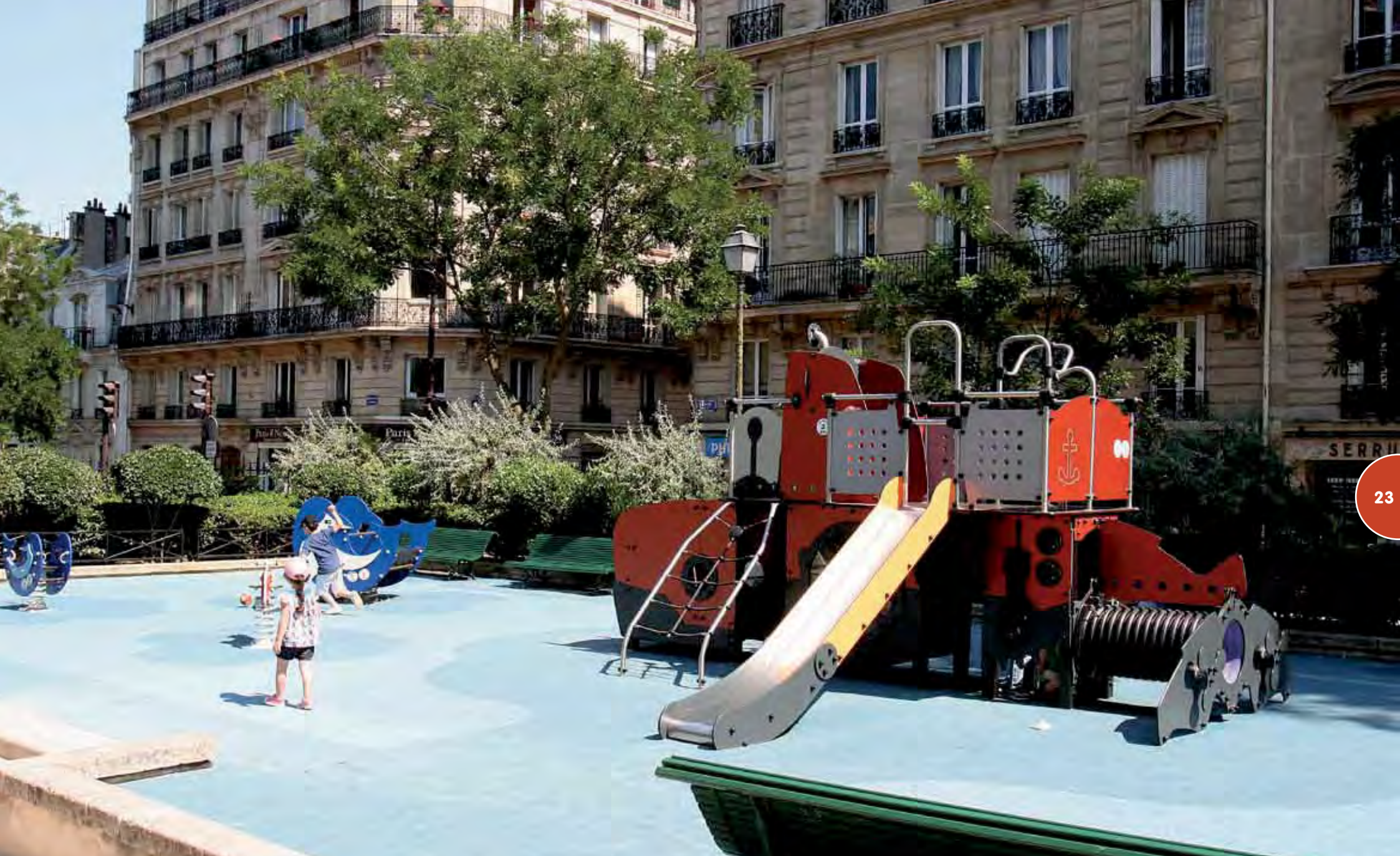
Speelsterrein met een Nautilus en veertoestellen.