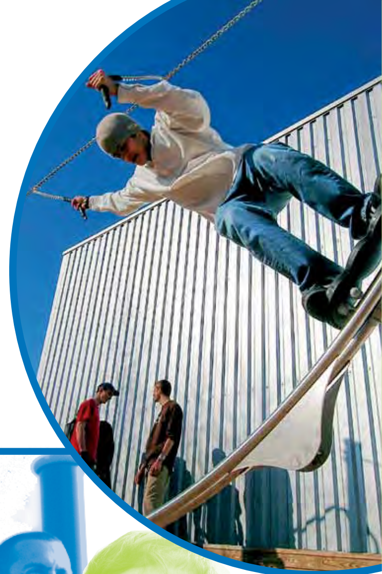
J2581M - Aéroskate®

De ruimtes zijn duidelijk afgebakend door de toestel keuzes, de afwerking van de vloeren en een zichtbare afscheiding. De ruimte voor de kleinste kinderen heeft een grote verscheidenheid aan speeltoestellen die passen bij hun capaciteiten. Daarbij is meubilair voor de begeleiders aanwezig. De jongeren ruimte heeft een indeling die dynamischer van aard is. Het bevat een Multisportterrein, Bewegende toestellen en een ontmoetingsplek.