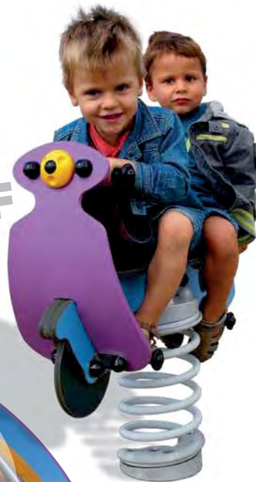
J842 - Dolce vita