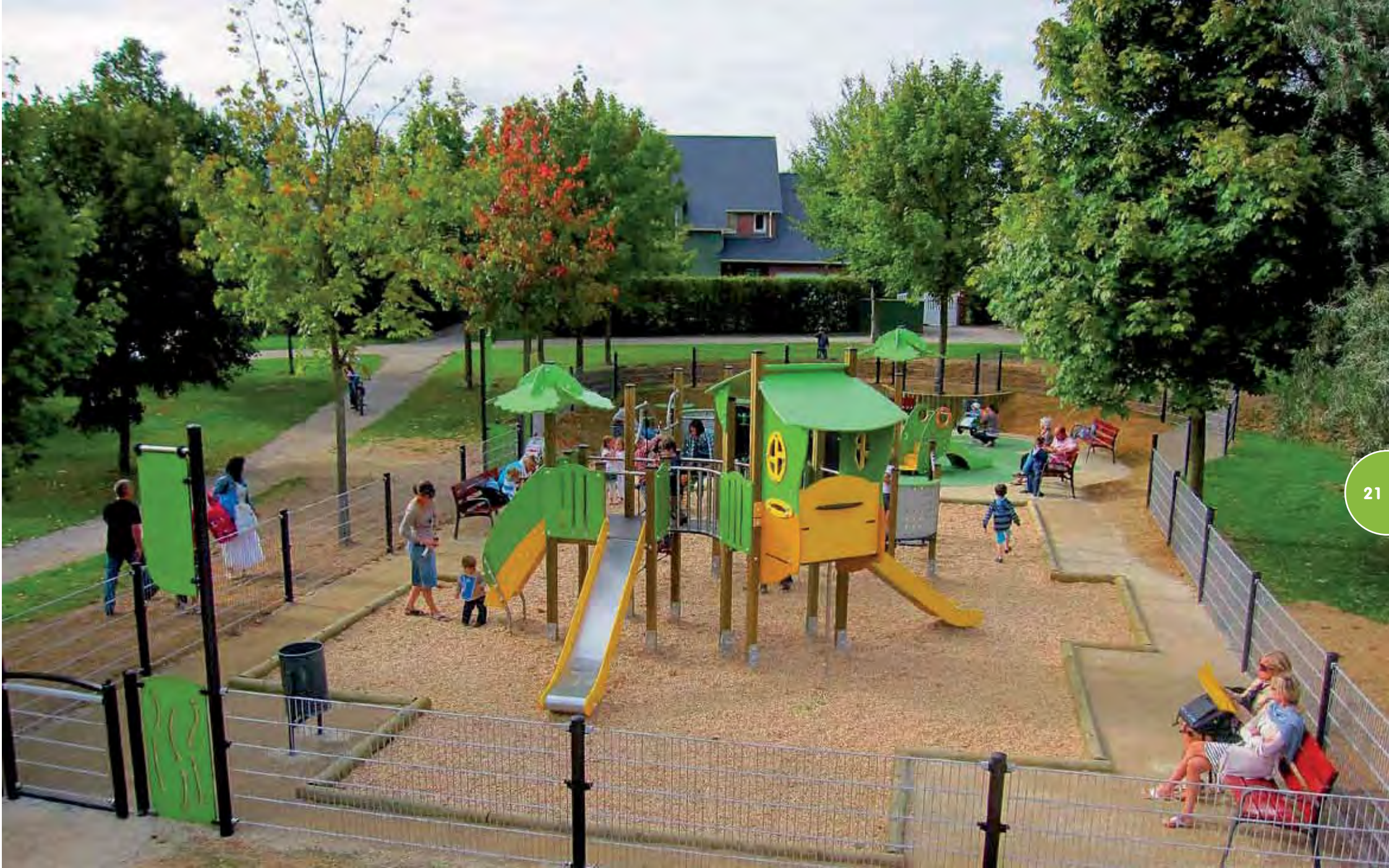
Speelterrein gerealiseerd met de Vivarea- en Tiboo-structuren.