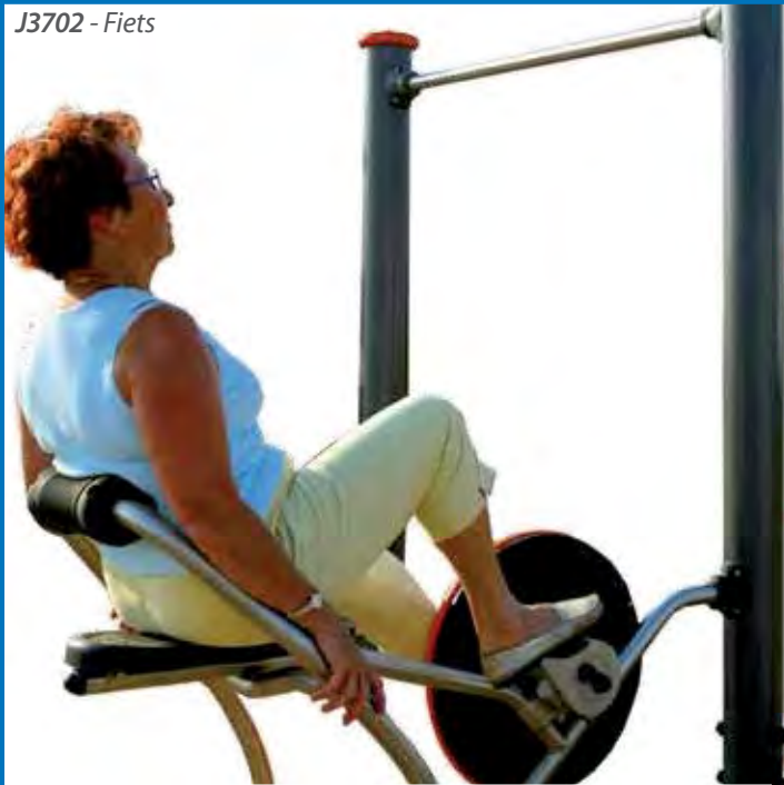
J3702 - Fiets