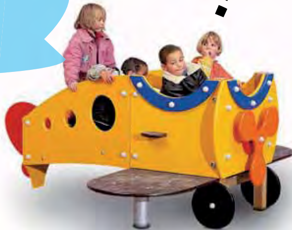
J2603 - Vliegtuig geel

Door een thematisch kader aan een speelterrein te geven, kunnen kinderen meegenomen worden naar een wereld waarin expressie en fantasie worden gestimuleerd. Veelal gebeurt dit door het aanbrengen van talrijke kleine details die verbonden zijn aan de toestellen of de inrichting zelf.