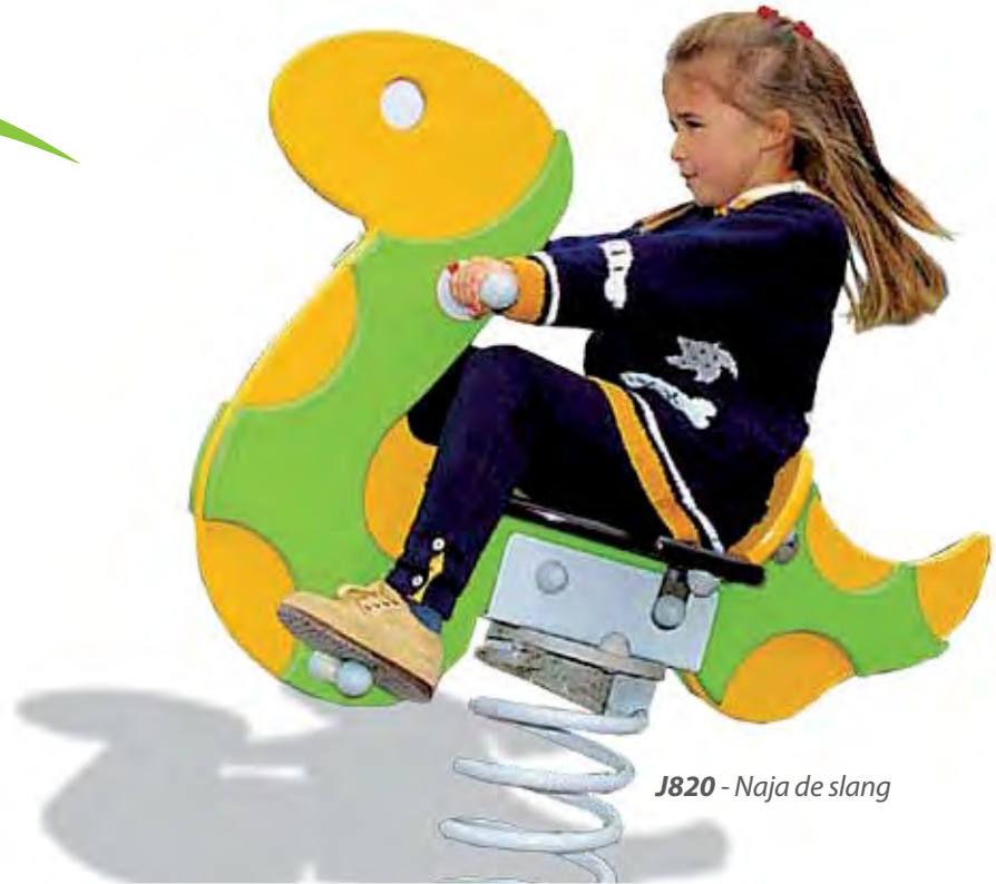
J820 - Naja de slang