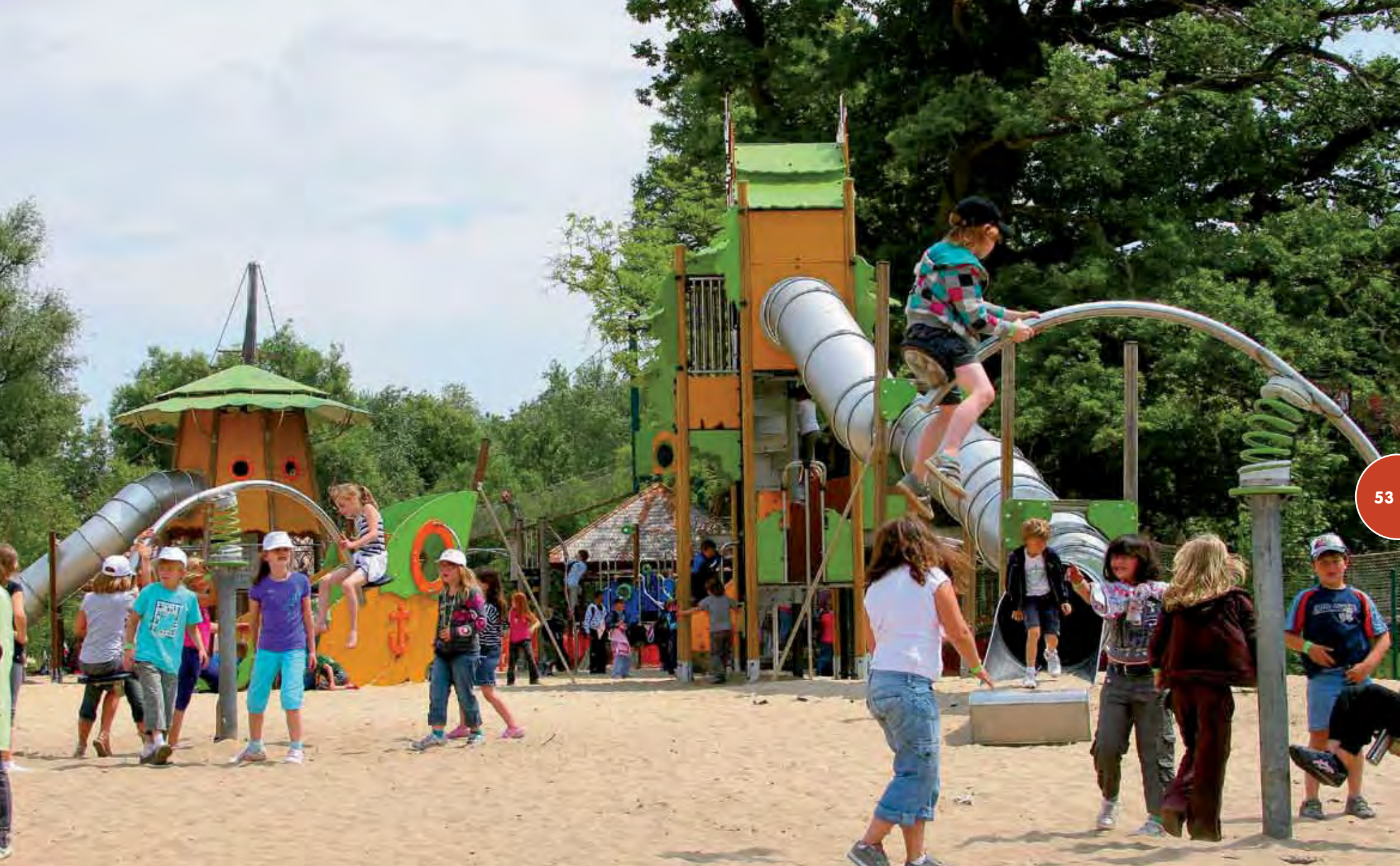
Brugellette (Paii Daiza) - België Speelterrein gerealiseerd met Kanopé-structuren en een Hip Hop-draaitoestel.