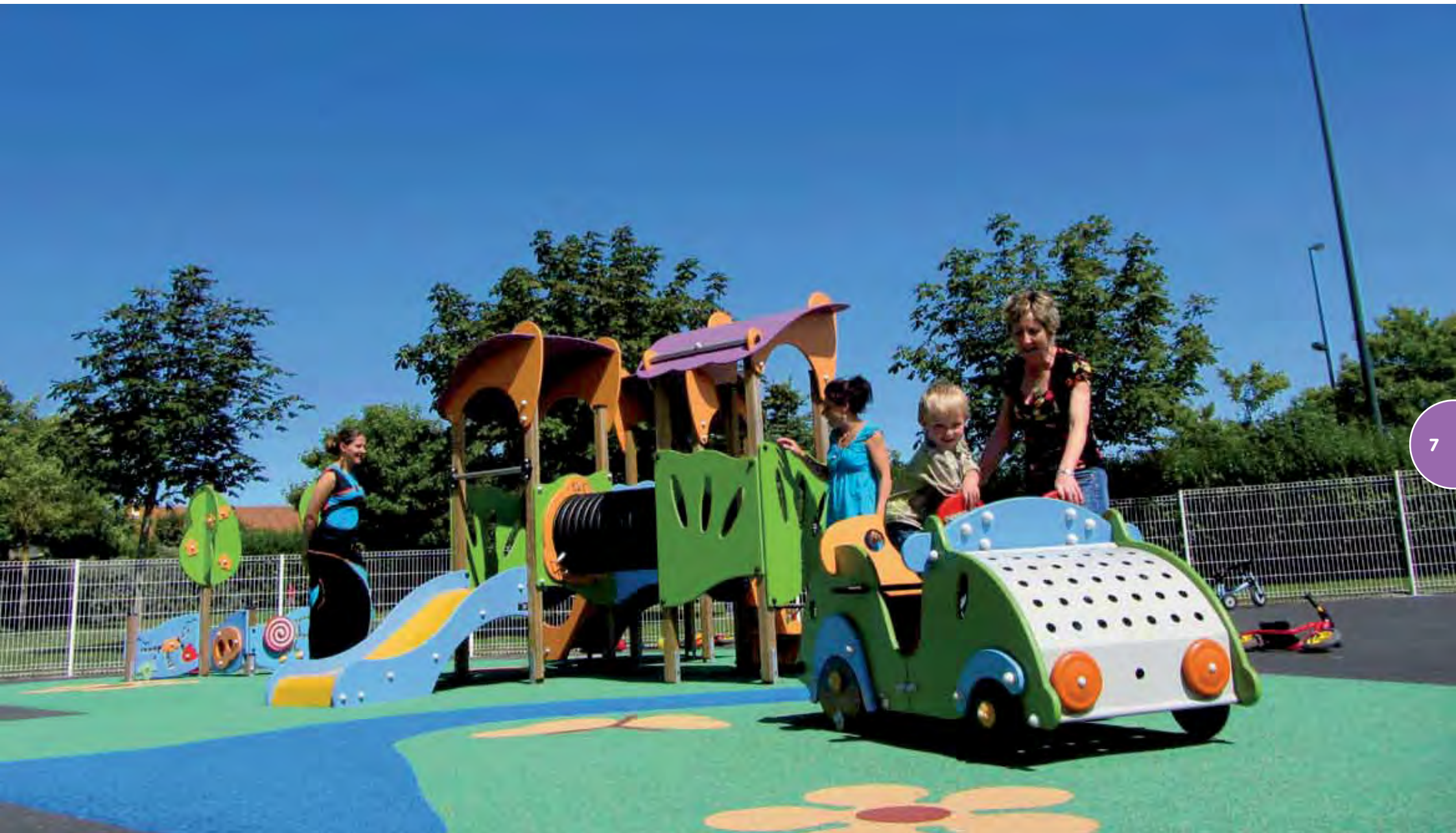
Speelterrein met een Tiboo-constructie en het thematische toestel De Grote Twiny.