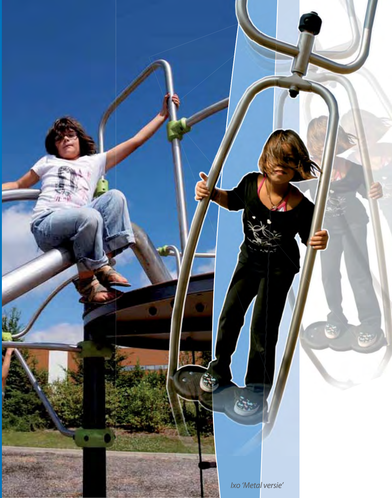
Ixo 'Metal versie'

Door een speelterrein te creëren in een woonwijk, krijgen kinderen de gelegenheid om vlak bij huis te spelen. Deze nabijheid stelt ouders gerust en draagt bij aan het gemeenschapsleven van de wijk.