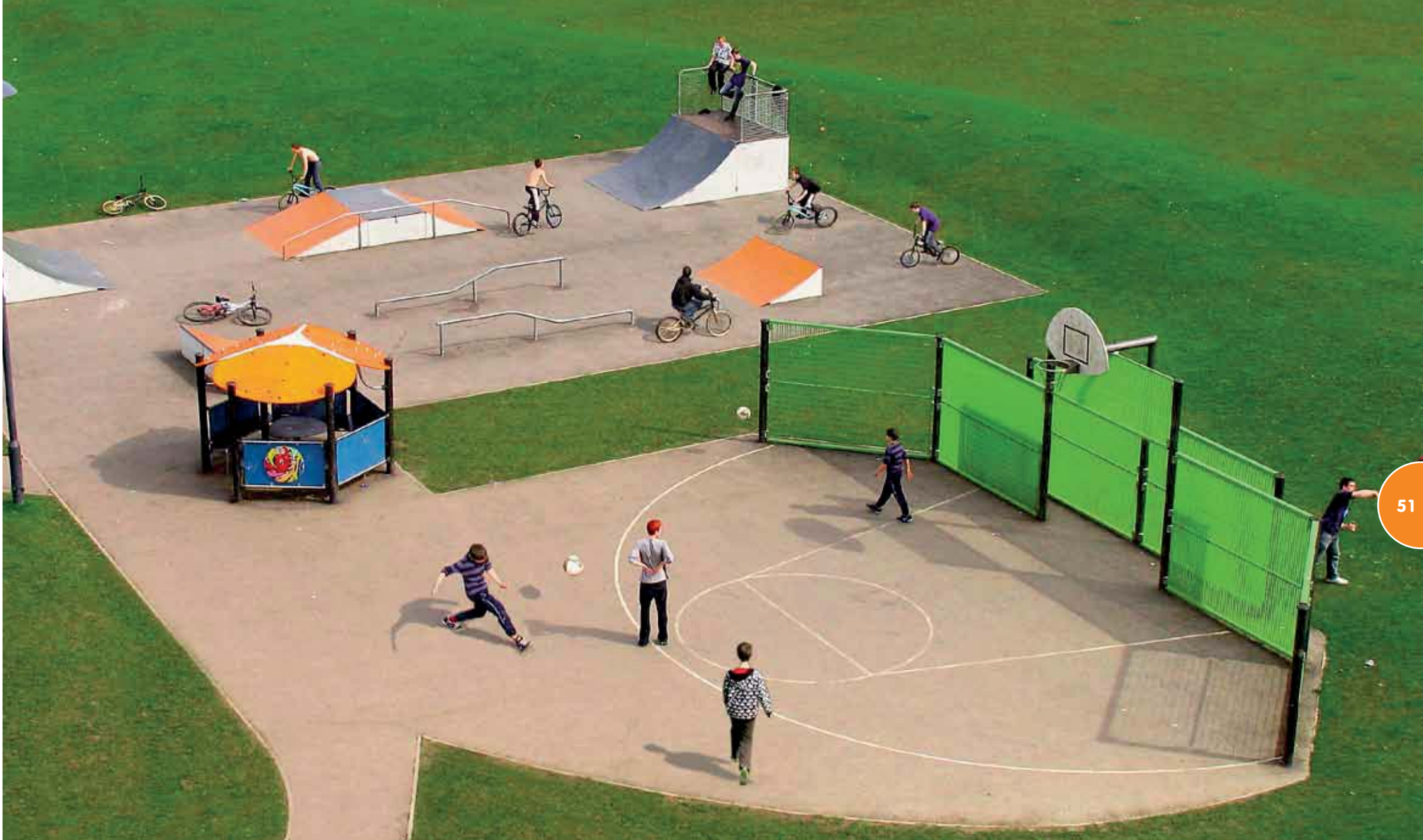
Speelterrein met een skatepark, een groot Multisportveld en een Ontmoetingsplek.