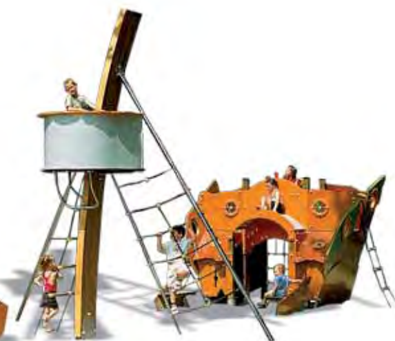
J2750 - Keo, het schip dat schipbreuk heeft geleden