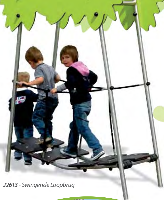
J2613 - Swingende Loopbrug