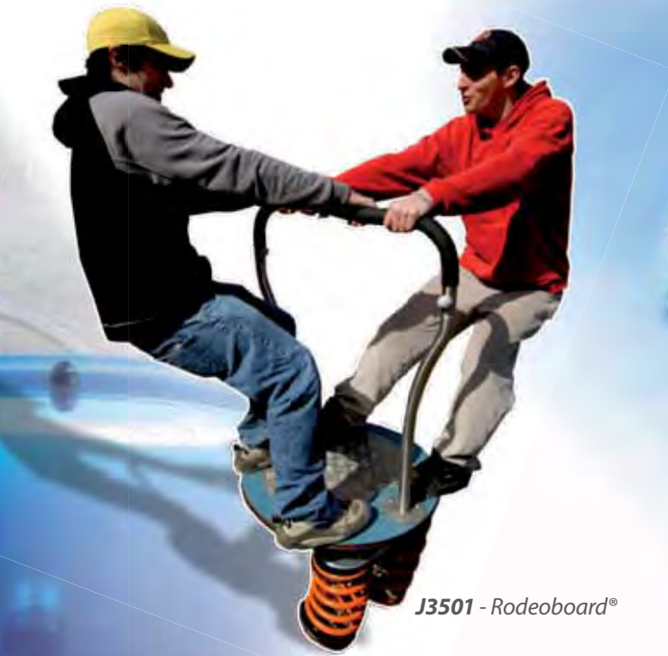
J3501 - Rodeoboard®