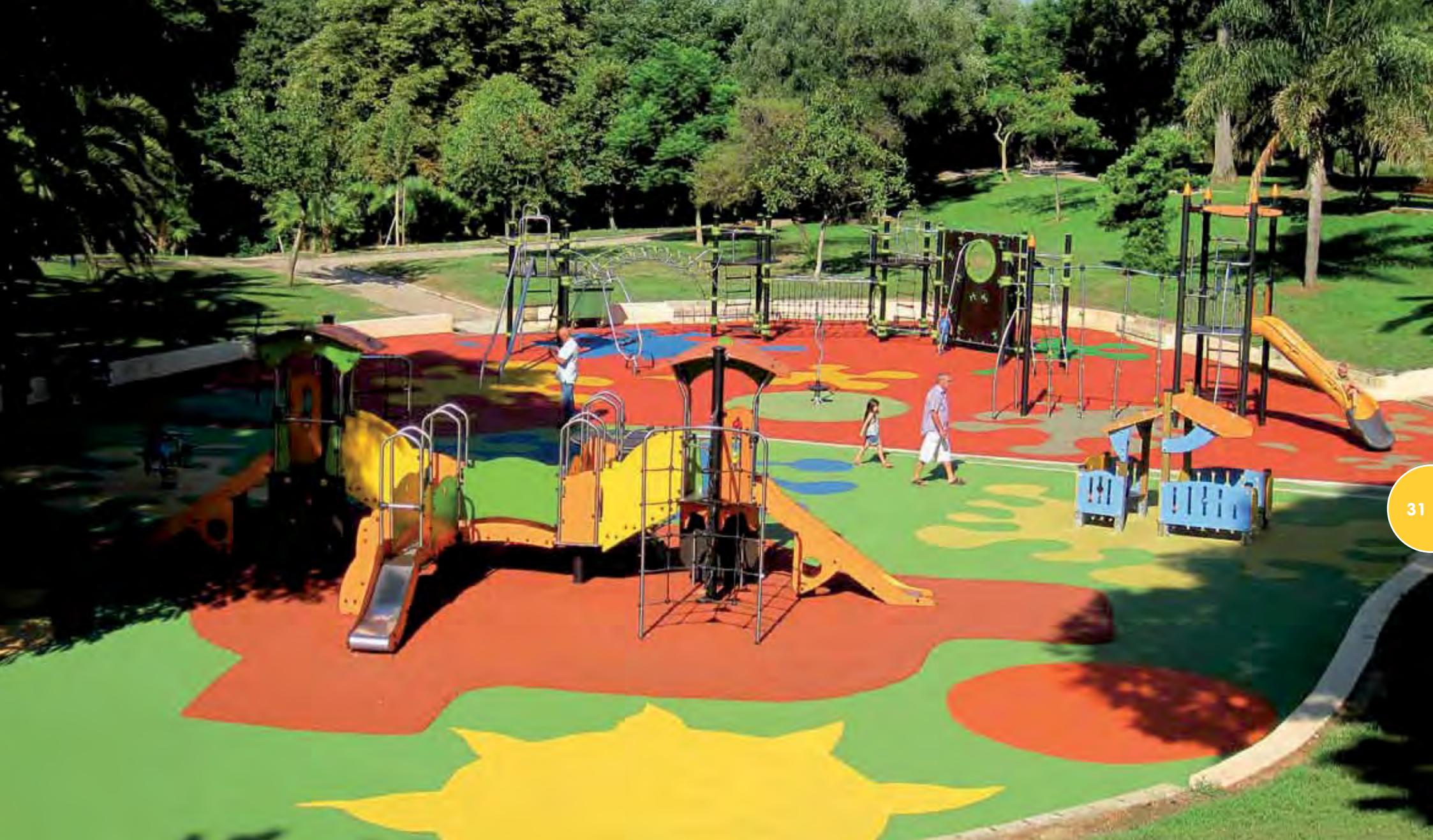
Speelterrein met structuren van de reeksen Diabolo, Biibox (versie met buizen) en Ixo.