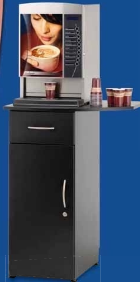
▲ Onderkast (bovenblad optioneel)