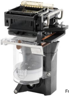
Fresh Brew Unit