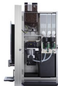
Bean NG 4