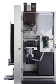
Bean NG 2