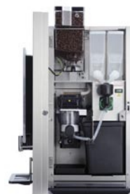
Bean NG 3