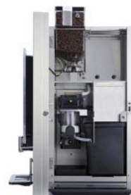
Bean NG 1