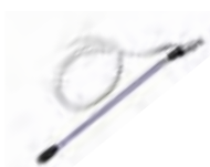
Gritstraal Set Code op aanvraag