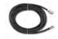
Riool Set 10 m 3.8007.TABP23853