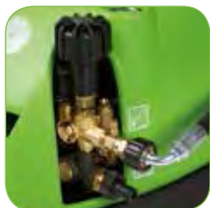
regelknop voor de werkdruk.