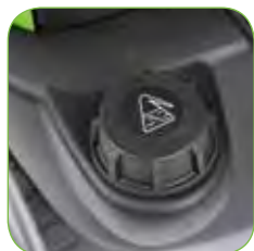
Ingebouwde 7,5 l reinigingsmiddelentank voor toevoer van chemicaliën onder lagedruk