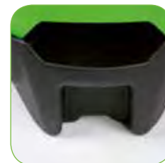
Grote steunvoet vooraan de machine t.b.v. een betere stabiliteit.