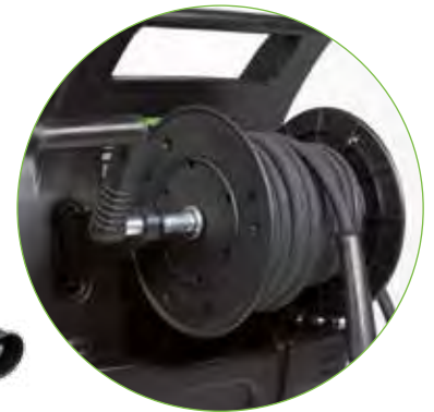
HASPEL (optioneel) 3.8007.KTRI45716