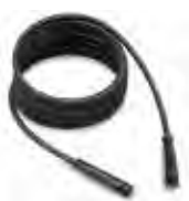
Hogedrukslang 10 m 3.8007.TBAP25324