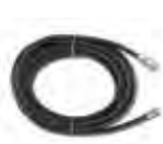
Rioolset 10 m of 20 m 3.8007.TBAP23853 3.8007.TBAP24406